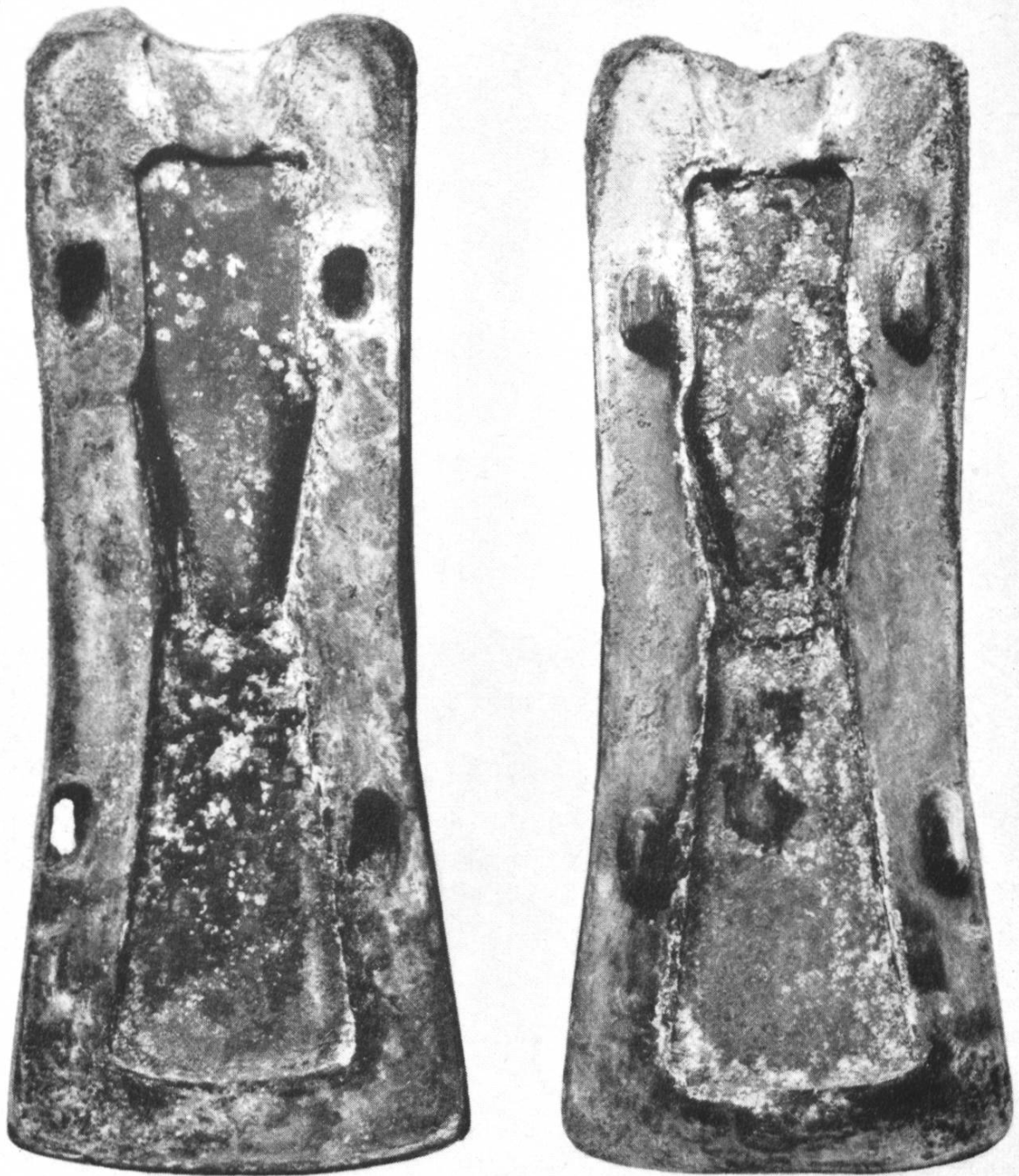
Abb. 12. Conters. Die offene Gussform.