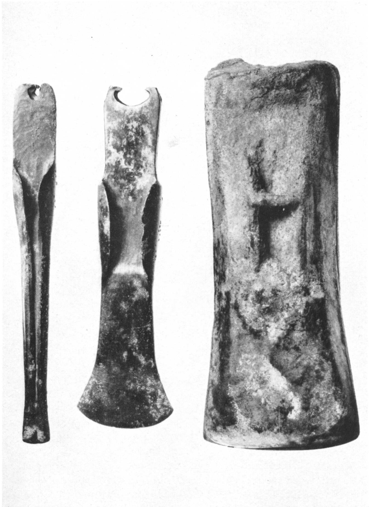
Abb. 11. Conters. Bronzedeptfund, rechts die geschlossene Gussform.