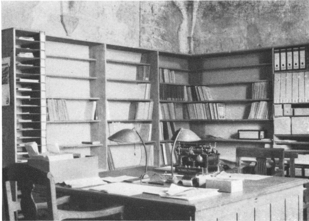
Fig. 13. Ispettorato degli scavi et dei musei, Ticino.

3. Dizionario storico-archeologico. I riferimenti archeologici di confronto, gli appunti bibliografici ecc. e le notizie storiche ticinesi vengono registrati in schede di \frac{1}{4} del formato normale che permettono una facile e rapida ricerca.