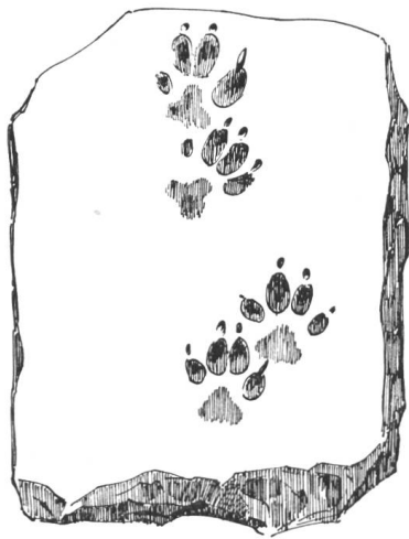
Abb. 39. Salet. Ziegelfragment mit Hundspfoten, rechts natürl. Grösse.

Beim Ausgrabungskurse 1946 des Institutes für Ur- und Frühgeschichte der Schweiz (U.-S. 1946, 42) fanden sich im Salet bei Wagen unter den sehr vielen Leistenziegelfragmenten auch einige mit Abdrücken. Die Tierspur ist die Fährte eines Haushundes. Der Abdruck des Menschenfusses weist darauf hin, dass ein Kind über die frischausgelegten Lehmziegel ging. Die Hand-