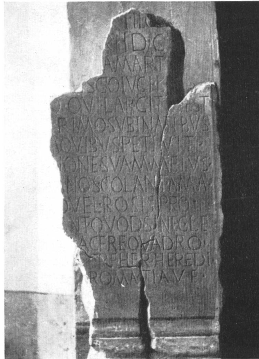
Fig. 37. Riva S. Vitale. Stele romana.

Nella riga ci sta solo o il nome della „tribus“ o quello del „cognomen“ ed è quindi lecito supporre tanto l'uno quanto l'altro. Troviamo infatti a Como: