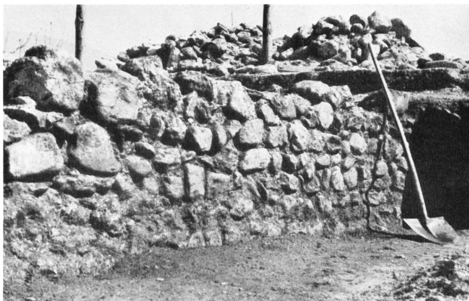
Abb. 20. Altreu. Mittelalterliche Mauer, vor 1375.

Diese Indizien werfen Probleme auf, die es in der gegenwärtigen, durch einen Hausbau veranlaßten Grabung zu lösen gilt. – In Form eines Achsenkreuzes sind zwei Schnitte über das später flächenhaft untersuchte Bauareal gezogen worden. Im östlichen Grabenende des Längsschnittes stieß man auf eine 1,65 m breite Mauer, die den innersten Wassergraben vom Städtchen trennt und dieses auf den beiden Landseiten umsäumt, was sich an Bodengestalt- und Verfärbung auf frisch gepflügten Äckern deutlich verfolgen läßt. Wir hatten damit die Stadtmauer gefunden. Im Querschnitt ergab sich eine zweite Mauer, die die Stadtmauer rechtwinklig trifft, von dieser aber durch eine Fuge getrennt wird. Sie muß zu einem großen anstoßenden Gebäude gehören (Abb. 20).