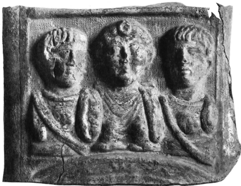
Abb. 44. Bonn. Mundband einer Schwertscheide aus Preßblech.

glieder der Dynastie der Situation jener Jahre, die sich folgendermaßen umreißen läßt.