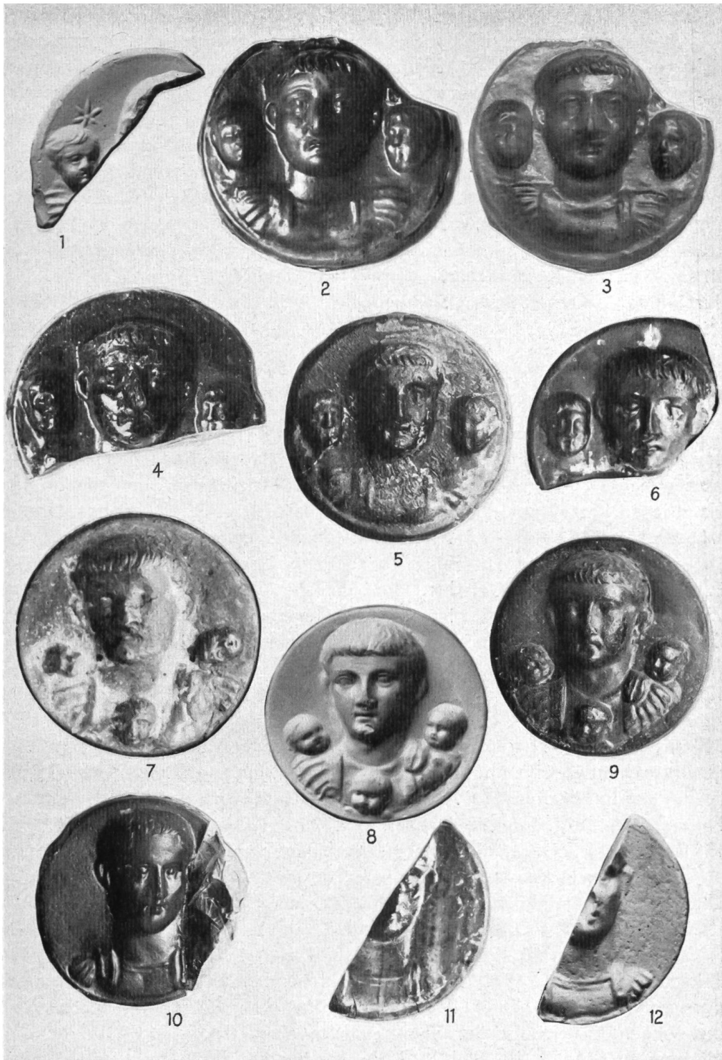
Tafel I. Römische Glasmedaillons: 1) Xanten, Mus. Bonn; 2-4) Nymwegen, Mus. Leyden; 5) British Museum; 6/7) Mus. Genf; 8) Colchester, British Museum; 9/10) British Museum; 11/12 Mainz, Röm.-Germ. Zentralmus.