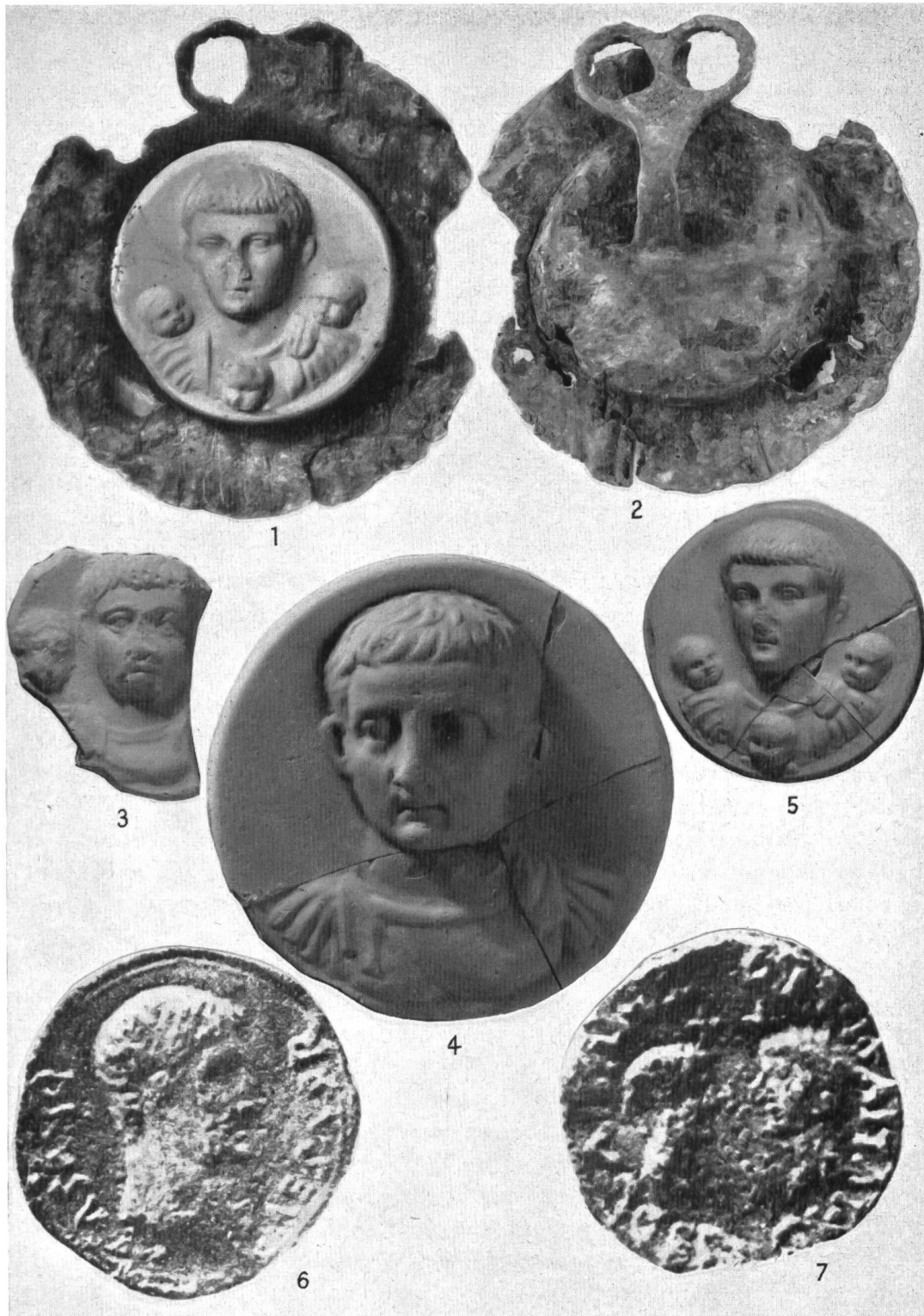
Tafel II. Römische Glasmedaillons: 1/2) Rheingönheim, Mus. Speyer; 3) Vechten, Mus. Utrecht; 4) Vindonissa, Mus. Brugg, 2 : 1; 5) Poetovio, Kunstmus. Wien; 6/7) Bleitessera, vermutl. aus Rom, vormals Berlin, 2 : 1.