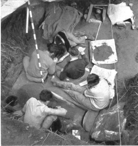
Fig. 36a. Collombey, la Barmaz II. Tombes néolithiques. Entre deux averses, on s'affaire délicatement autour de deux tombes.