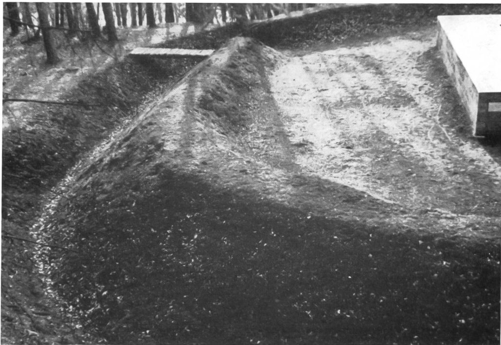
Abb. 7. Rheinau, römische Warte. Spitzgraben, Wall und Durchlaß auf der Südseite.