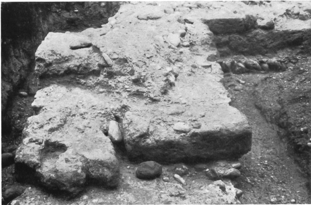
Abb. 3. Rheinau, römische Warte. Reste der Toranlage.