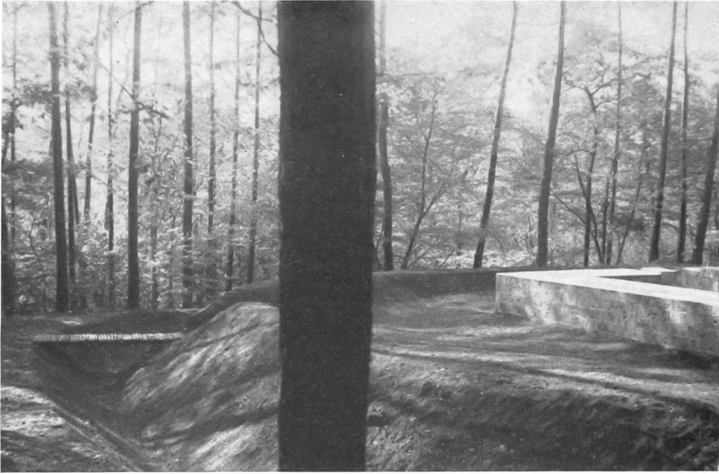
Abb. 6. Rheinau, römische Warte. Blick von Südosten auf die vollendete Anlage (Photo O. Germann, Zürich).