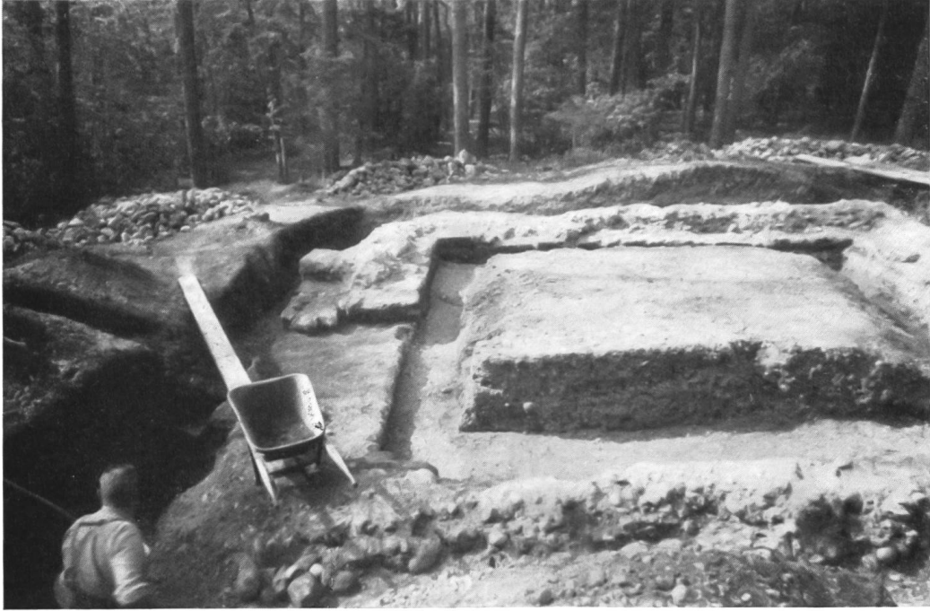
Abb. 2. Rheinau, römische Warte. Blick von Süden auf die sorgfältig ausgegrabene Anlage.