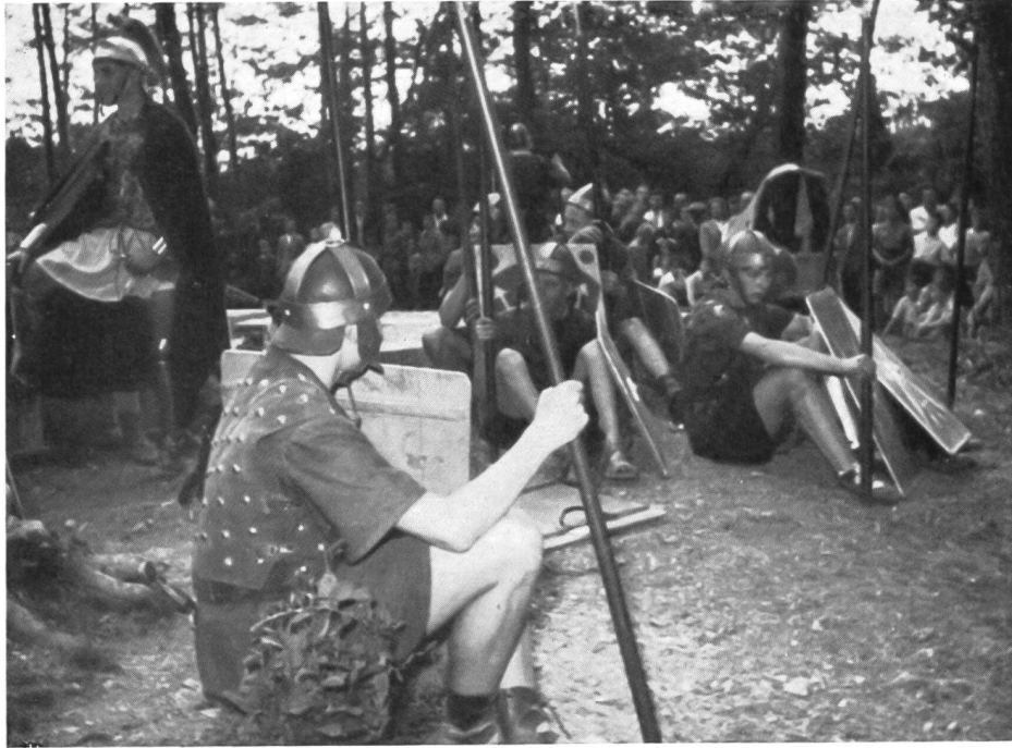
Abb. 10. Rheinau, römische Warte. Szene aus dem Festspiel der Schüler.

Die südliche Hälfte der äußeren Anlage, also Hofraum, Wall und Graben, ist wieder hergestellt worden. Die unveränderte nördliche Hälfte zeigt den stark eingeschwemmten Spitzgraben noch sehr deutlich, und der Hofraum bleibt weiterhin im Fundzustand mit einer 80–90 Zentimeter mächtigen Schuttmasse überdeckt. Leider war es unmöglich, die voraussetzende Palisade am Innenwall nachzuweisen. Wir haben deshalb darauf verzichtet, ein Teilstück derselben wiederherzustellen. Ob der in der Südwestecke beobachtete Walldurchlaß dem ursprünglichen Zustande entspricht, ließ sich nicht mit Sicherheit feststellen.