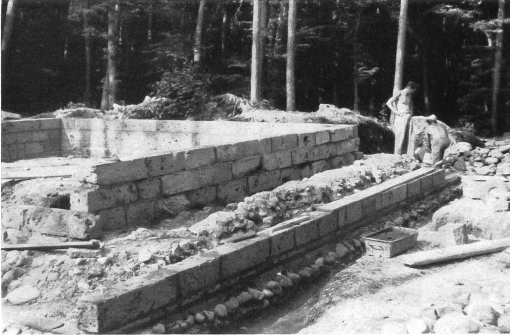
Abb. 4. Rheinau, römische Warte. Die Ergänzungsarbeiten am Turm.