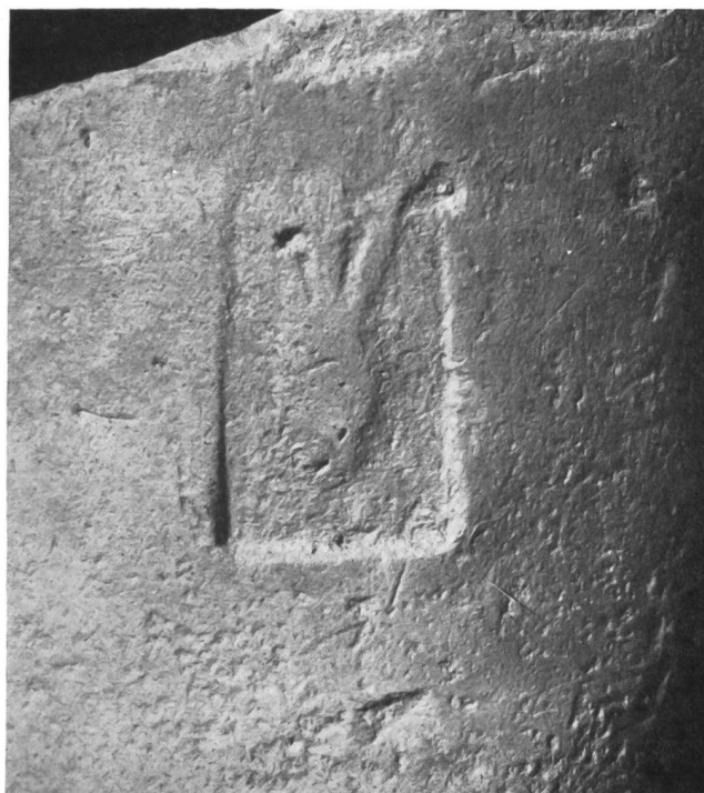
Fig. 11. Vidy, la Maladière. Estampille d'amphore en forme d'amphore allongée.

L'estampille est placée à 8 cm environ au-dessus de l'extrémité inférieure. Elle est rectangulaire, mesurant 23 sur 40 mm environ, assez mal venue dans sa partie supérieure. L'objet qui s'y trouve représenté est une amphore allongée,