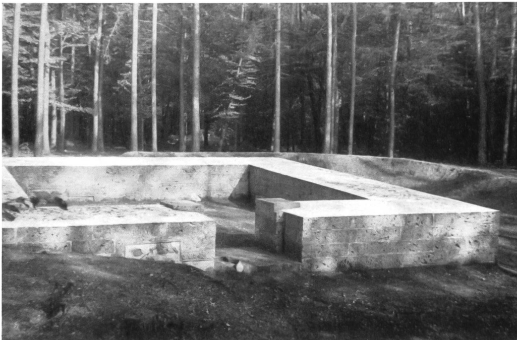
Abb. 5. Rheinau, römische Warte. Blick von Westen auf das ergänzte Mauerwerk mit Toranlage.