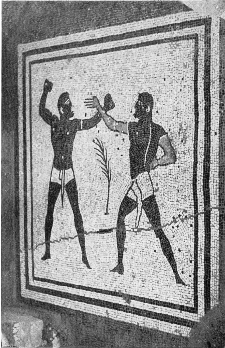
Fig. 30. Massongex. La mosaïque des thermes (Vallesia, X, 1955, Pl. I)

Cette mosaïque est d'un style qui n'était pas encore représenté dans notre pays; l'étranger en possède, par contre; à Parme, deux motifs très semblables à celui de Massongex ont été retrouvés dans les restes du théâtre romain. Jus-