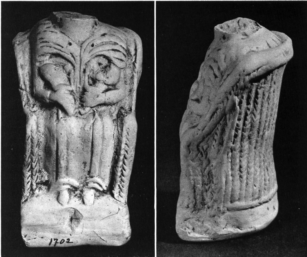
Abb. 38. Vidy. Bruchstück einer Tonstatuette, gefunden 1937, etwas verkleinert.

Nacken zum Chignon gerafft ist. Ein Teil wird von diesem als Scheitelzopf zur Stirn geführt, über welcher seine Enden zur Doppelrosette aufgesteckt sind. Das Köpfchen sitzt auf einem unverhältnismäßig dicken, am Schulteransatz gebrochenen Hals. Doch läßt sich eben noch erkennen, daß der Oberkörper nach vorn und hinten zu unmittelbar ausläßt, um einer stehenden Figur zugehören zu können. Wie der fehlende Teil der Gestalt zu ergänzen wäre, zeigt das 1937 gefundene Fragment 6 einer langgewandeten Frau, die auf einem Flechtstuhl mit hoher Rückenlehne und Armstützen sitzt (Abb. 38). In jedem Arm hält sie einen Säugling an die Brust. Das Ärmelkleid scheint über den Brüsten zu fehlen oder faltig zusammengeschoben wiedergegeben; doch soll damit wohl nur das Saugen der Kleinen, die mit einem Händchen nach der Mutterbrust greifen, deutlicher gezeigt werden. Die Statuette ist aus auch im Bruch gleichmäßig elfenbeinweißem Pfeifenton gearbeitet. Der fehlende Kopf saß auch hier auf einem, wie die Bruchfläche zeigt, unförmig dicken Hals. Doch wird dies hier, vor allem aus der Seitenansicht, verständlich als bedingt zur Überleitung zum ausgerundeten, in den biegsamen Korbstuhl geschmiegteten Rücken. Die Verschiedenheit von