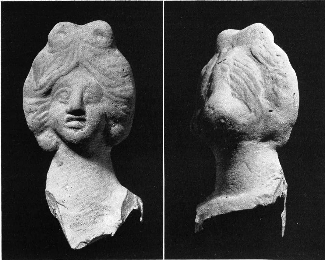
Abb. 37. Vidy. Bruchstück einer Tonstatuette, 1956 gefunden, natürliche Größe.

das bewegliche Hab und Gut der allerersten Bewohner der Colonia Julia Equestris, der nahen Hafenstadt Nyon bieten, das uns infolge der Überbauung dieser Stadt noch so gut wie unbekannt ist.