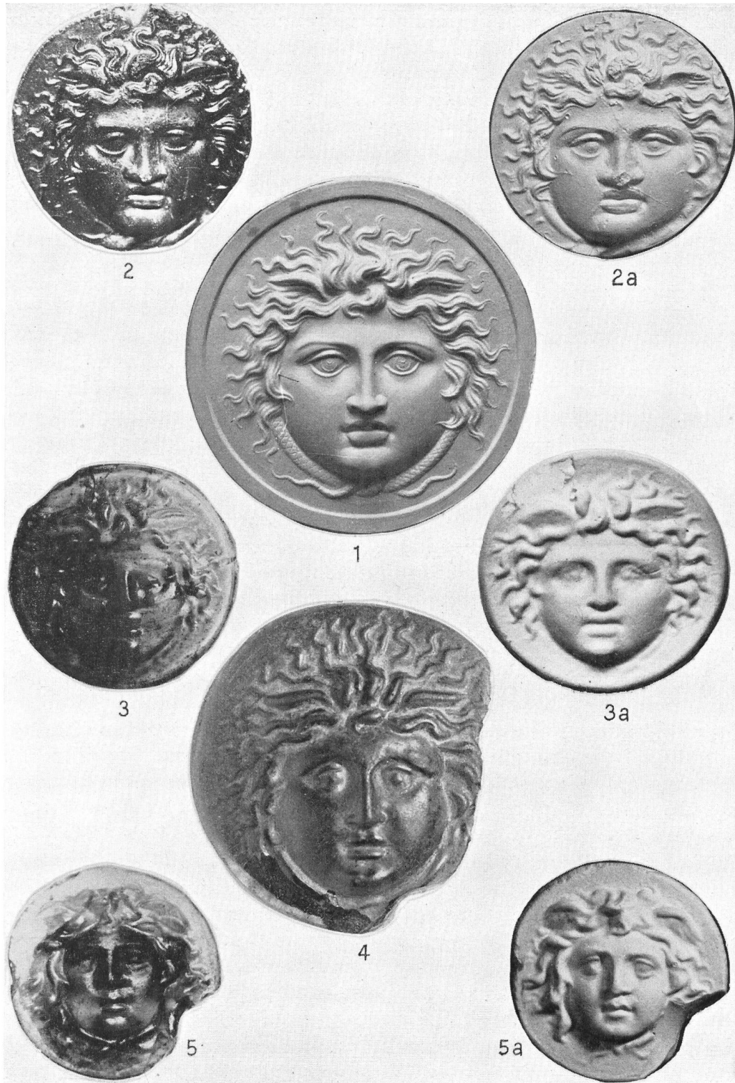
Tafel II. 1. Gipsabguß eines Glasmedaillons, Coll. Cades (1:1). 2. Glasmedaillon, Privatsammlung in Italien (1:1). 2a. Dasselbe nach Gipsabguß. 3. Glasmedaillon aus Vindonissa in Brugg (1:1). 3a. Dasselbe nach Abguß. 4. Glasphalera aus Xanten in Bonn (1:1). 5. Glasmedaillon aus Vindonissa in Aarau (1:1). 5a. Dasselbe nach Abguß.