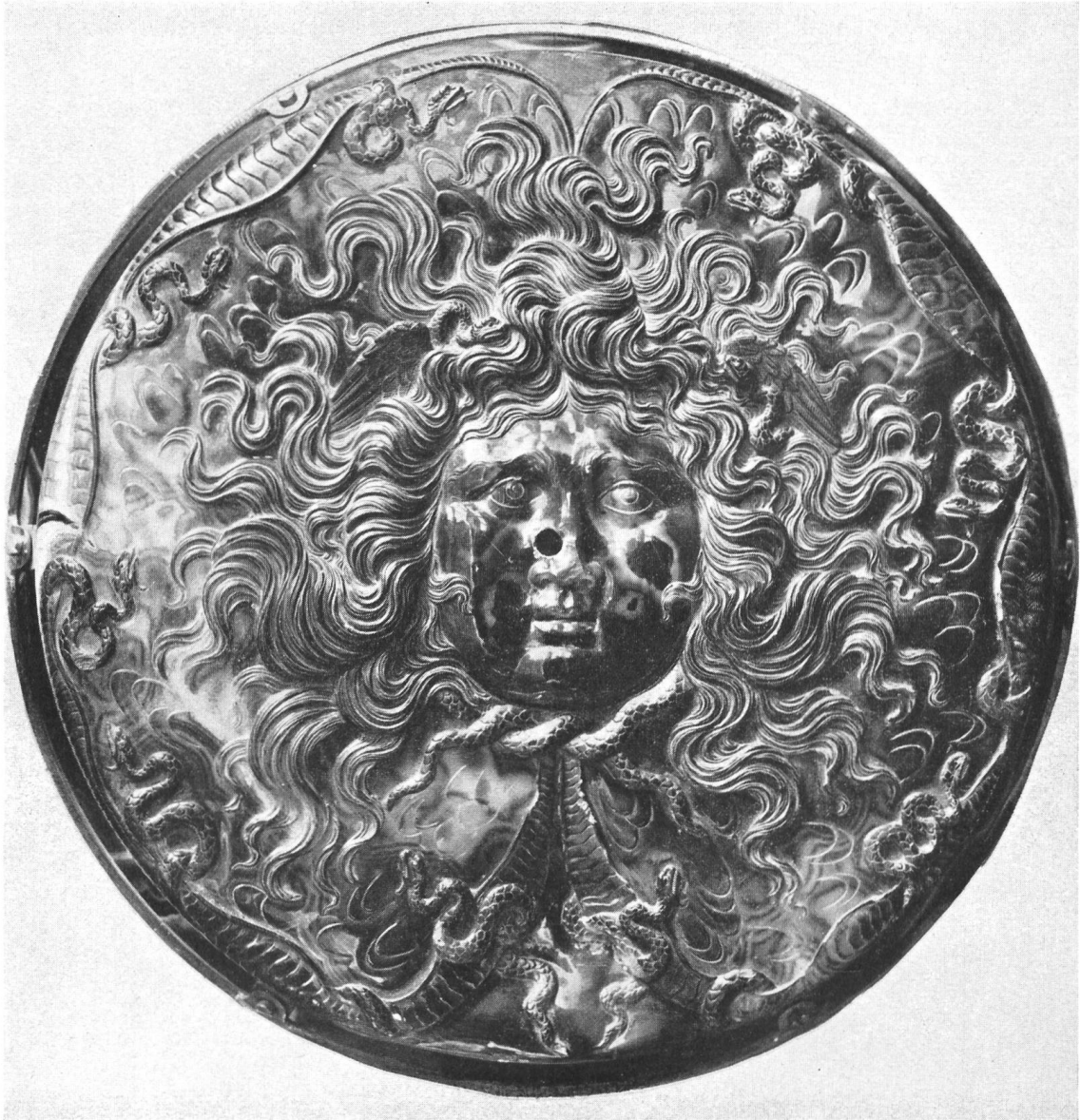
Tafel V. Gorgoneion auf der Tazza Farnese in Neapel.