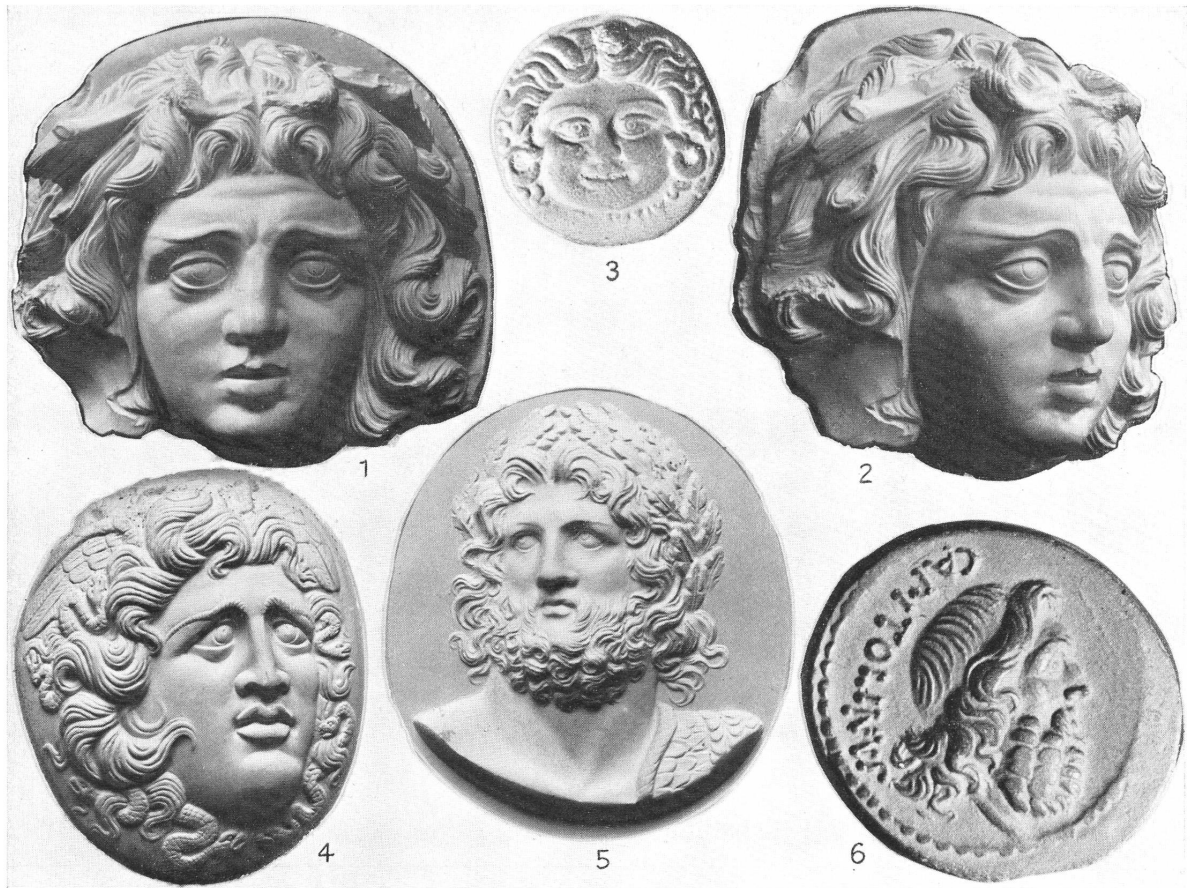
Tafel IV. 1–2. Chalzedon-Phalera der Sammlung M. Roš, Baden (1:1). 3. Denar des L. Plautius Plancus, 45 v. Chr. (vergr.). 4. Amethyst-Cameo im British Museum aus Rom (vergr.). 5. Sardonyx-Medaillon aus Ephesos in Venedig (vergr.). 6. Denar des Petillius Capitolinus in Wien (vergr.).