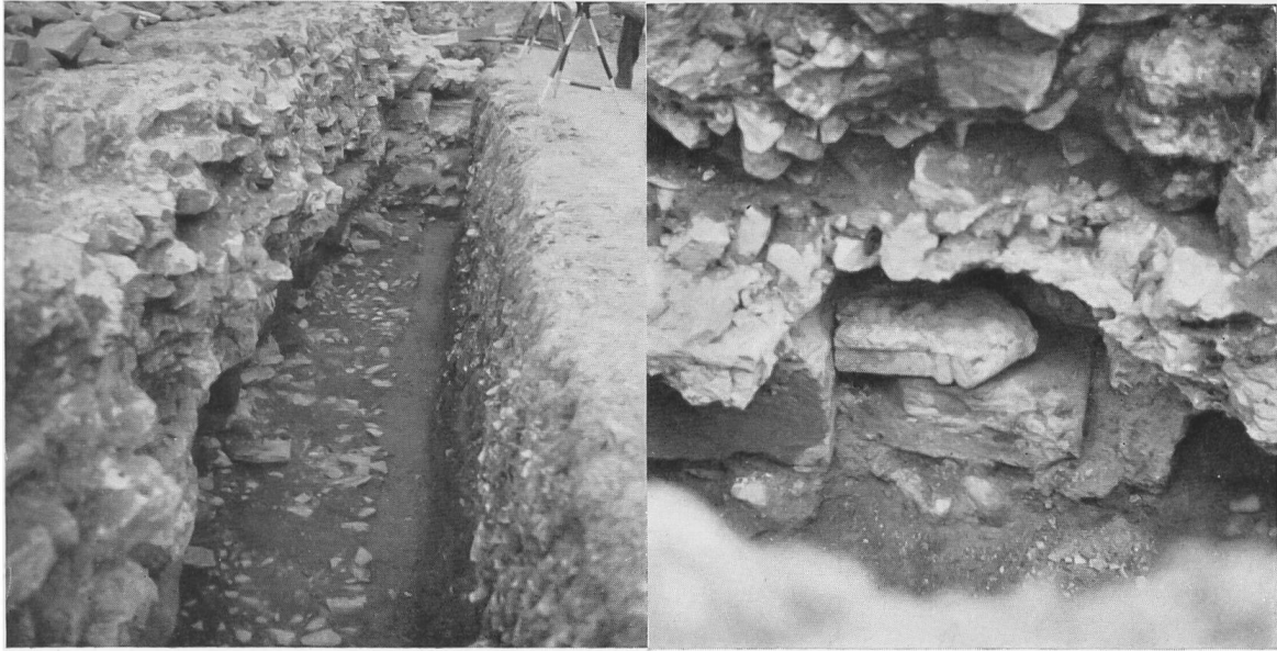
Abb. 54. Kaiseraugst. Heidenmauer gegen Turm 4; Abb. 55. Fundlage der Venus-Statue, nachdem sie vom unten Fundamentunterlage, auf der die Quader lagen. Füllmauerwerk ringsum befreit war.

hochgeführt, während das Innere mit kleinsteinigem Mauerwerk ausgefüllt wurde. Vereinzelt Architekturstücke wurden aber auch noch weiter oben, sozusagen als Armierung eingebettet. Über der Erde war die Mauer mit Handquadersteinen sauber verblendet.