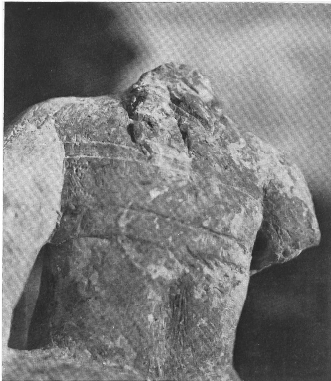
Abb. 52. Kaiseraugst. Venus, Rückenpartie, Haarlocken und Binde.

aber provinziell verstärkt und verfrüht – in der allgemeinen Stilentwicklung der römischen Kunst begründet, die von einem fortschreitenden Abbau des organisch-logischen Körpergefühls gekennzeichnet ist; d.h., die Unstimmigkeiten zwischen Vorder- und Rückseite rühren mit auch daher, daß dem Künstler an einer allseitigen Durchgliederung des Körpers im Sinne der klassischen Rundplastik gar nicht mehr gelegen war.