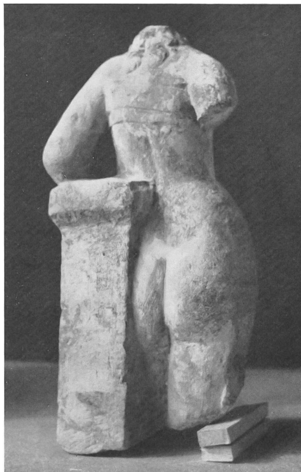
Abb. 51. Rückansicht.

All diese Ungeschicklichkeiten geben aber bei der Begutachtung des Werkes das eine ab: dieser provinzielle Künstler, der in den letzten Jahrzehnten vor der Zerstörung der Colonia Raurica die Venus aus der Heidenmauer schuf, scheint kein sklavischer Kopist gewesen zu sein. Unter der Masse von hellenistischen Terrakotten und römischen Statuen und Statuetten aus Marmor und Bronze, welche die Liebesgöttin darstellen, finden sich zwar angelehnte Aphroditen, Aphroditen mit Brustbinden und auch Typen mit einem ähnlichen, unserer Statue vergleichbaren, wenn auch nie genau übereinstimmenden Spiel des Gewandes 2 . Ein griechisch-römisches Werk aber, in dem diese Motive vereint vorkommen, kennen wir nicht. Es scheint fast, daß uns in der Venus aus der Heidenmauer ein neuer Statuentypus beschert worden ist, der, wenn nicht alles trügt, eine mutige Neuschöpfung der Spätzeit darstellt, im Sinne eines freien Nachbildens und Zusammentragens verschiedener bekannter Motive.