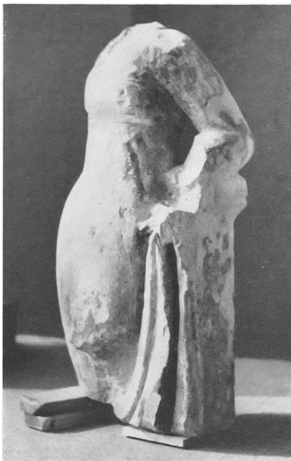
Abb. 50. Kaiseraugst. Venus, Seitenansicht mit Pfeiler.