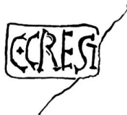
Fig. 12. Nyon, timbre du potier C. Crestius. Gr. nat.