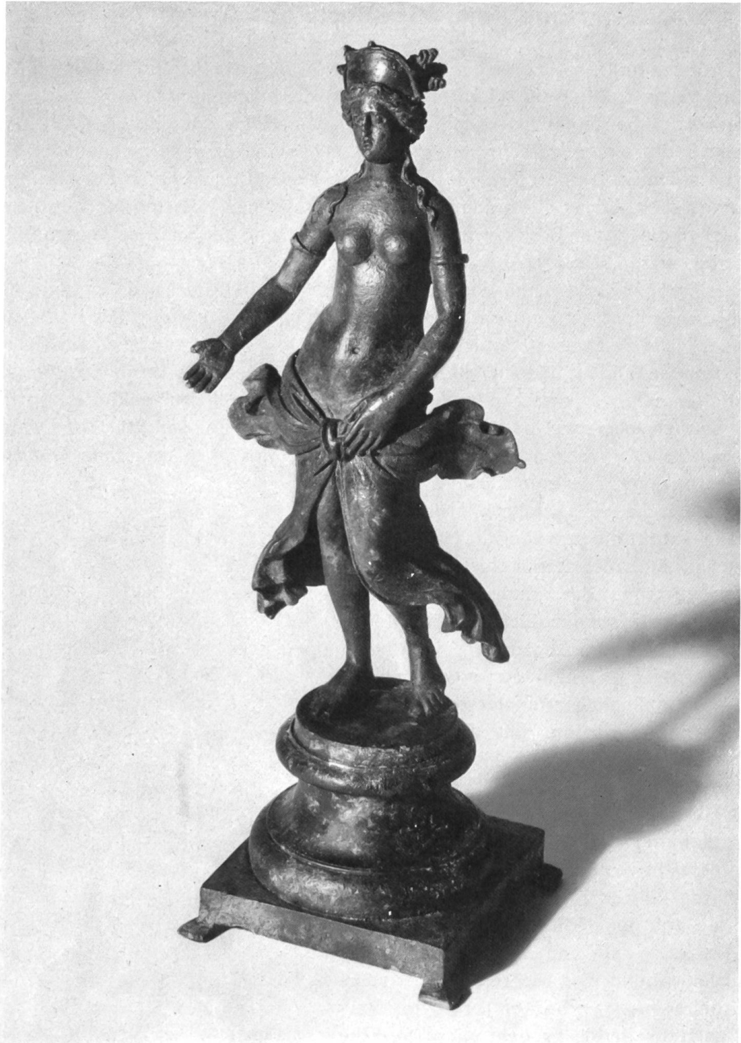
Abb. 14. Augst. Statuette der Venus, aus Bronze, ohne die Goldreifen, gereinigt.