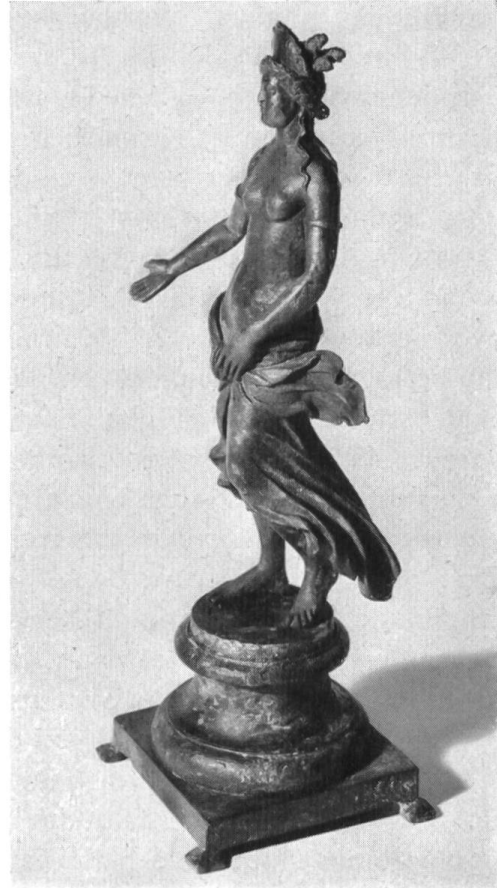
Abb. 16. Augst. Seitenansicht.

göttin 3 . Mit der Gebärde der Hand vor dem Schoß verbindet sich bei spät-klassischen Aphroditebildern eine scheue Haltung; die Oberschenkel sind eng aneinandergedrückt, der Blick geht beobachtend in die Ferne 4 . Davon ist unsere Augster Statuette vollständig verschieden. Es geht dem römischen Meister nicht um das Verstehen des göttlich-weiblichen Wesens, sondern um das Wirkungsvolle der Erscheinung. Er hat deshalb das ungewöhnliche Motiv gewählt, den Mantel vor dem Schoß zu knoten, so daß zwei Zipfel seitlich wie bei einer Kravattenschleife hinauswehen; unten bläht sich der Mantel um die Beine. So wirkt das Einerschreiten der Göttin viel unbekümmerter als bei den