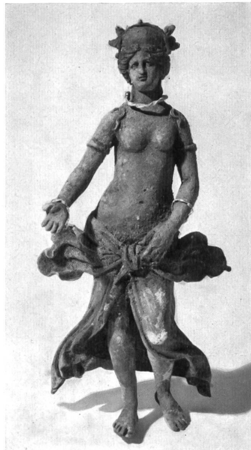
Abb. 13. Augst. Statuette der Venus mit Goldreifen, im Fundzustand, ohne Sockel.

Alle Motive dienen, die wunderbare Erscheinung der Göttin zu steigern: sie tritt leicht vor uns hin, getragen vom rechten Bein, das linke nur mit der Fußspitze auf der Höhe der rechten Ferse aufsetzend und den Oberkörper leicht zurücklehnend. Die rechte Hüfte ist stark ausgebogen; das Becken breit im Verhältnis zur Brust. Es geht nicht nur die klassische S-Schwingung durch die Gestalt, sondern auch eine doppelte Torsion, von der linken Fußspitze zum Leib, und vom links hängenden Gewandzipfel durch den linken Arm zum Haupt, das etwas zu