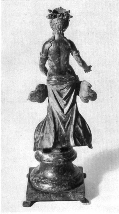
Abb. 15. Augst. Rückseite der Statuette.

Die rechte leicht vorgehaltene Hand hielt vermutlich wie so oft eine Spendeschale, die mit dem rechten Daumen abgebrochen ist 2 . Daß die linke Hand das Gewand nahe dem Schoß berührt, ist der uralte Gestus der Liebes-