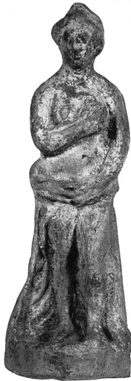
Abb. 22. Neapel, Inv.-Nr. 20756.