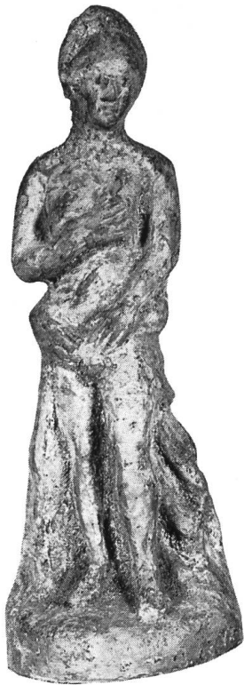
Abb. 21. Neapel, Inv.-Nr. 20754.