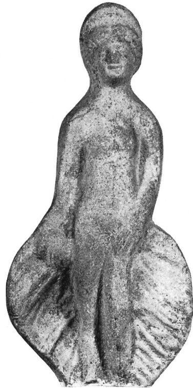
Abb. 23. Neapel, Inv.-Nr. 20387.