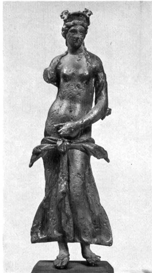
Abb. 18. Trier. Statuette der Venus, aus Bronze.

als Stütze für das große Gewandstück, das vom linken Arm über den Kopf zum jetzt verlorenen rechten Arm führte und diesen umschlang.