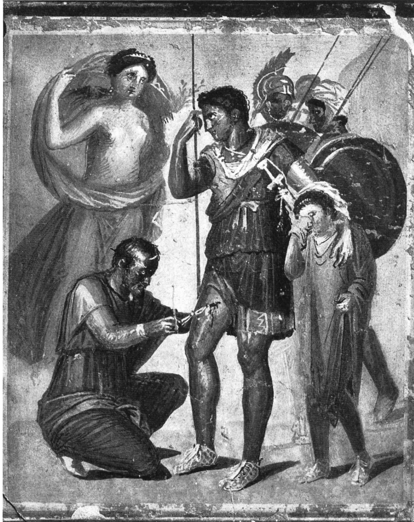
Abb. 19. Pompeji. Wandbild: Heilung des Aeneas. Neapel, Nationalmuseum.

gedrängt. Dieses Bild, in dem sich das Schreitmotiv natürlich ergibt, erklärt nun zwei Punkte, die die Augster Statuette mit der Trierer Venus gemeinsam hat: Venus trägt das Götterdiadem, ihr Gewand ist für das Schreiten vor dem Schoß geknotet. Die Erklärung für den Schleier der Göttin, wie ihn die Bronze von St. Germain aufweist und er bei der Trierer Venus zu ergänzen ist, wird ebenfalls von der angeführten Vergilstelle gegeben: Hoc Venus obscuro faciem circumdata nimbo detulit... Es handelt sich demnach um die Velificatio , einen Ausdruck der Majestät göttlicher Erscheinung, in die auch die Vorstellung von geheimnisvoller Umwölkung und Dunkelheit hereinspielen kann 15 . Der Typus der Göttin, die entschleiert vor ihrem Mantel erscheint, geht auf eine großartige Schöpfung der späten Klassik zurück. Der beste Zeuge ist die Tongruppe aus Larisa am Hermos mit ihren Verwandten 16 . Er ist dann für mancher-