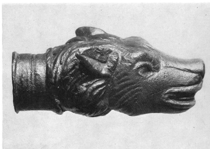
Fig. 7. Avenches. Chantier «en Pré Vert»: applique en bronze.

4. Sur le terrain de M. J.-C. Treyvaud, des thermes romains ont été mis à jour, en face de ceux de Perruet (Fig. 9). Leur plan en est différent: une vaste salle de 13 m sur 15 m, le tepidarium, est entourée de locaux plus restreints, également chauffés par hypocaustes. Les vestiges d'une décoration somptueuse, en marbre, y ont été retrouvés partout. Fait curieux à signaler, ces fragments de