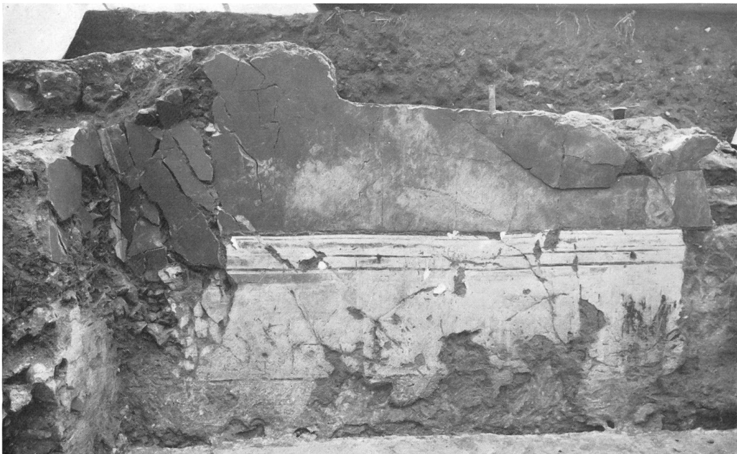
Fig. 10. Avenches. Chantier Treyvaud: paroi de fresques romaines in situ.