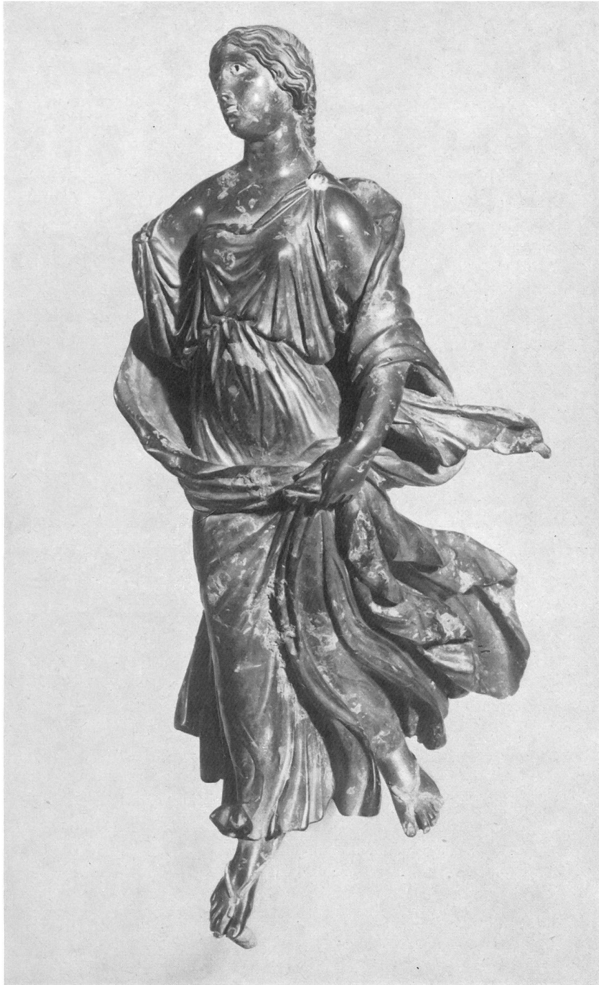
Fig. 8. Avenches. Chantier Treyvaud: statuette en bronze, hauteur 15 cm.