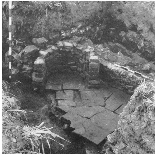
Fig. 5. Avenches. Canalisation: four romain trouvé près du «Transformateur».