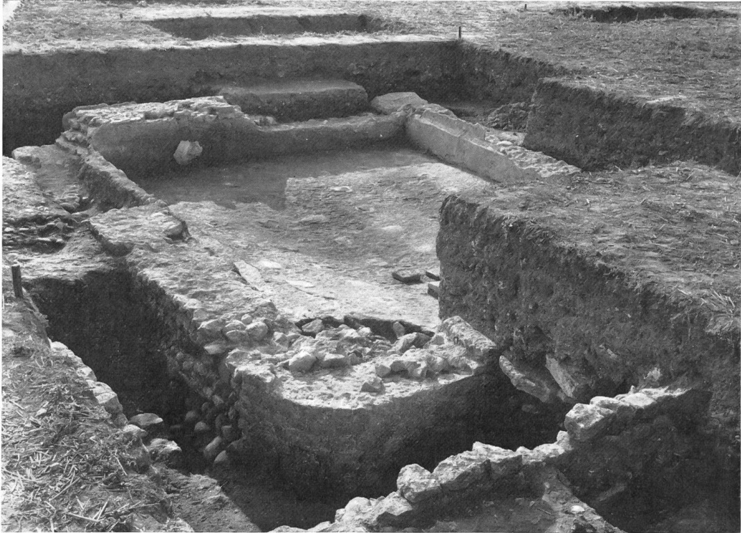
Fig. 9. Avenches. Chantier «aux Conches dessous» (M. Treyvaud): vue des bains.