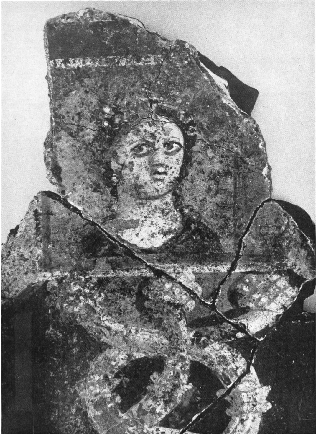
Fig. 11. Avenches. Chantier Treyvaud: fresques romaines du 1er siècle.