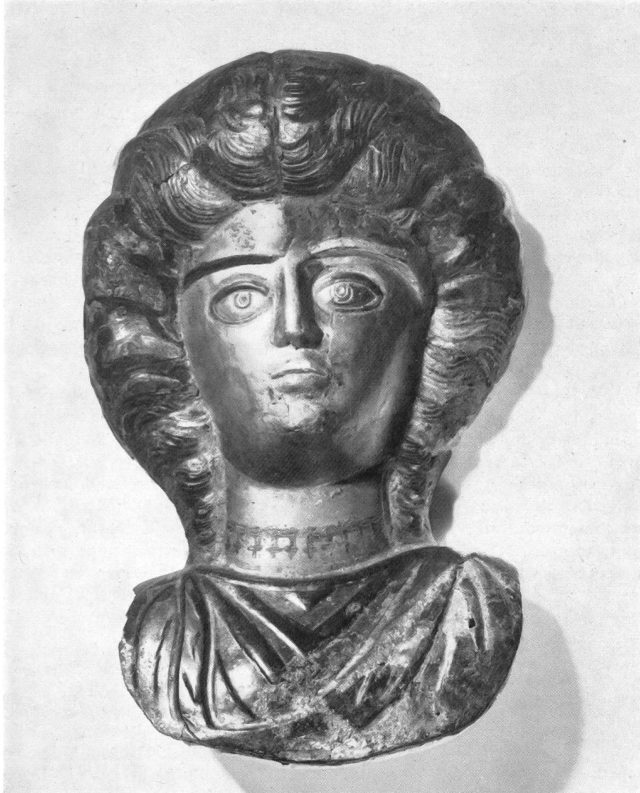
Abb. 12. Augst. Insula 30. Büste einer Frau aus Bronze, getrieben, versilbert. 1. Hälfte 3. Jh.

Da demnächst von der Stiftung Pro Augusta Raurica der erste wissenschaftliche Grabungsbericht über die topographischen Ergebnisse auf dem «Steinler» herausgegeben wird, beschränken wir uns heute darauf, einige hervorragende Einzelfunde aus der reichen Ernte herauszugreifen.