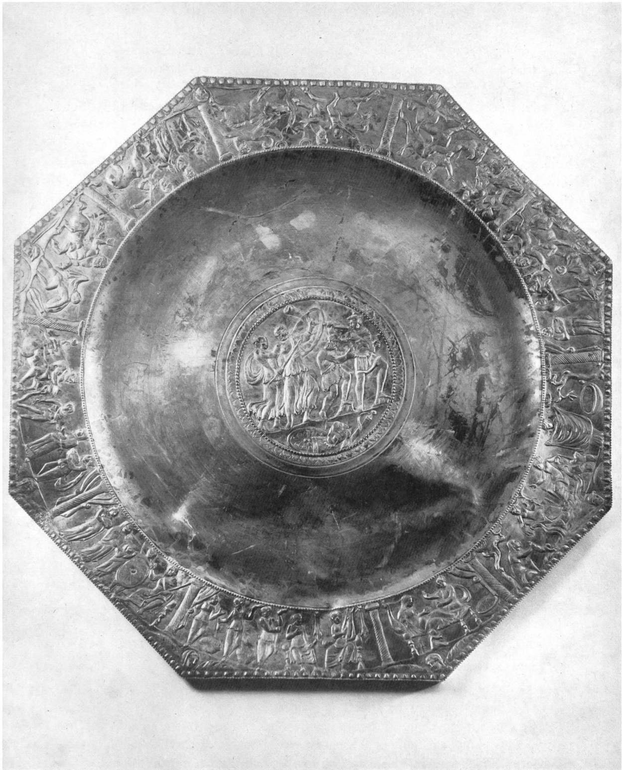
Abb. 15. Kaiseraugst, AG. Spätromischer Silberschatz; Platte aus Silber mit der Jugendgeschichte des Achilles. Durchmesser 52 cm.