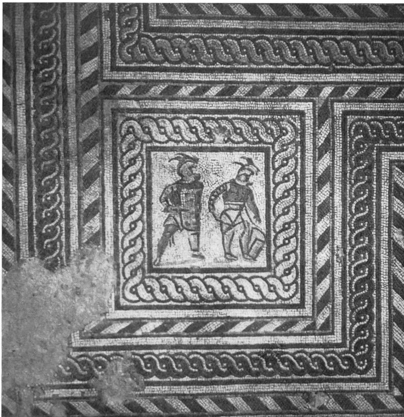
Abb. 14. Augst. Farbiger Mosaikboden. Zwei Gladiatoren im Kampf.