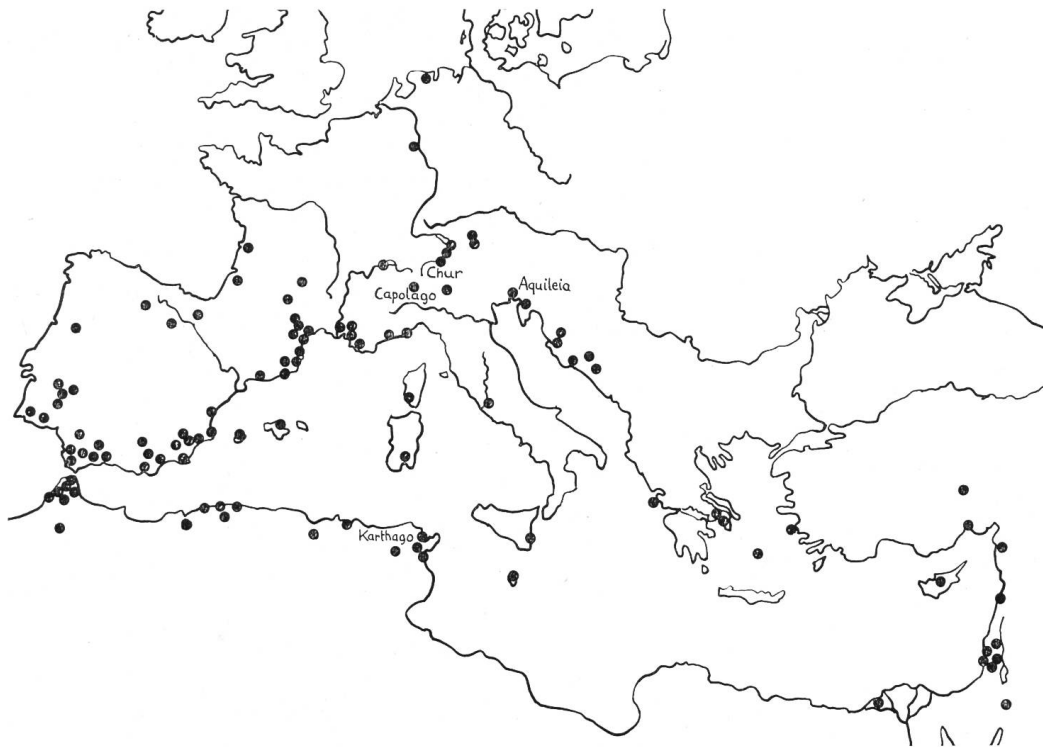
Abb. 16. Fundorte spätrömischer roter Stempelkeramik (nach der in Anm. 7 und 8 genannten Literatur).

Im Gebiete der heutigen Schweiz gab es bisher nur zwei Exemplare dieser Keramikgattung, nämlich ein Bruchstück in Genf 2 und einen ganzen Teller aus Capolago im Museum Bellinzona 3 (Abb. 15). Die nächsten und besten Parallelen finden sich jedoch in Kastell Schaan, Liechtenstein 4 . Anlässlich der Veröffentlichung der Stücke von Schaan ist ausführlich über die ganze Gattung gehandelt worden. Danach soll hier nur eine allgemeine Übersicht skizziert werden.