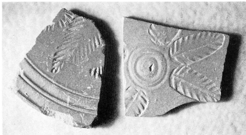
Abb. 14. Spätrömische, rote Stempelkeramik aus Chur. Maßstab 1:1.

Wir haben zwei flache Tellerboden-Scherben vor uns (Abb. 14) von eigentümlich blaßroter Farbe aus einem sehr homogenen, festen Ton, der hart gebrannt ist. Die matte Oberfläche hat keinen sichtbaren Überzug. Sie präsentiert eine fehlerlose, weiche Glätte, wie sie nur ausgesprochener Qualitätsware eigen ist. Schwach in diese Fläche eingedrückt finden sich Reste von Palmettenmustern. Man kennt solche Teller aus dem Mittelmeerraum, nach denen die Churer Fragmente unschwer zu ergänzen sind. Das Stempelmuster zierte die Mitte des großen Tellerbodens und zwar meist als ein achteiliger Stern aus Palmetten mit kleineren Motiven, meist Kreisen, als Füllungen in den Zwickeln.