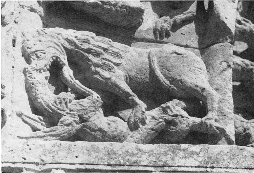
Fig. 28. Aulnay. Portail central de la façade occidentale. Vertu terrassant un Vice.

V. H. Debidour 4 démontre l'origine antique de nombreuses formes animales courantes au moyen-âge, citant les sources littéraires ou iconographiques les plus connues et les mieux répandues par les clercs de l'Église. La mise en parallèle des conceptions antiques et médiévales dépasserait de loin les possibilités des présentes observations, mais nous ne devons pas oublier que d'autres thèmes, typiquement antiques, furent repris par l'Église et par ses artistes, prouvant par là la connaissance profonde de l'antiquité au moyen-âge. L'humanisme renaissant cherchait ses sources et son inspiration dans l'antiquité et plus particulièrement chez les penseurs et chez les poètes. La présence, autour de la Vierge du portail méridional de la façade occidentale de la cathédrale de Chartres, des figures du trivium et de quadrivium est une preuve certaine de la profonde connaissance que le moyen-âge eut de l'antiquité. Cicéron près de la Vierge ne pourrait étonner que ceux qui voudraient à tout prix qu'une interruption soit née entre le monde antique et le monde moderne.