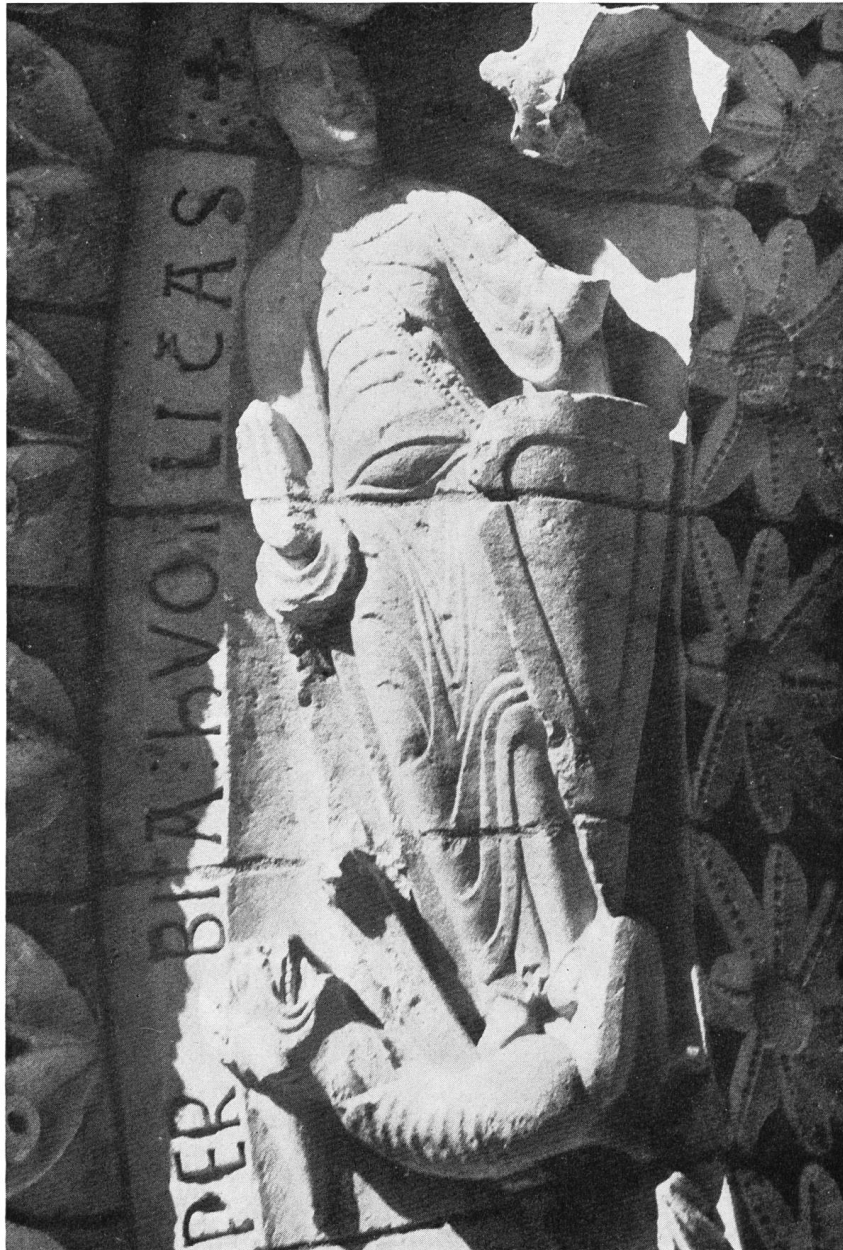
Fig. 29. Aulnay. Lutte entre un lion et un griffon.

des Vices qui se tortillent sous la lance sont directement inspirées par le texte de Prudence ou plus probablement par le de spectaculis de Tertullien 5 .