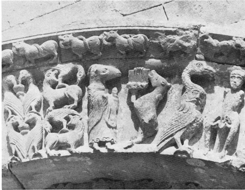
Fig. 26. Bélier en vêtements sacerdotaux lisant l'évangile que lui présente un autre quadrupède.