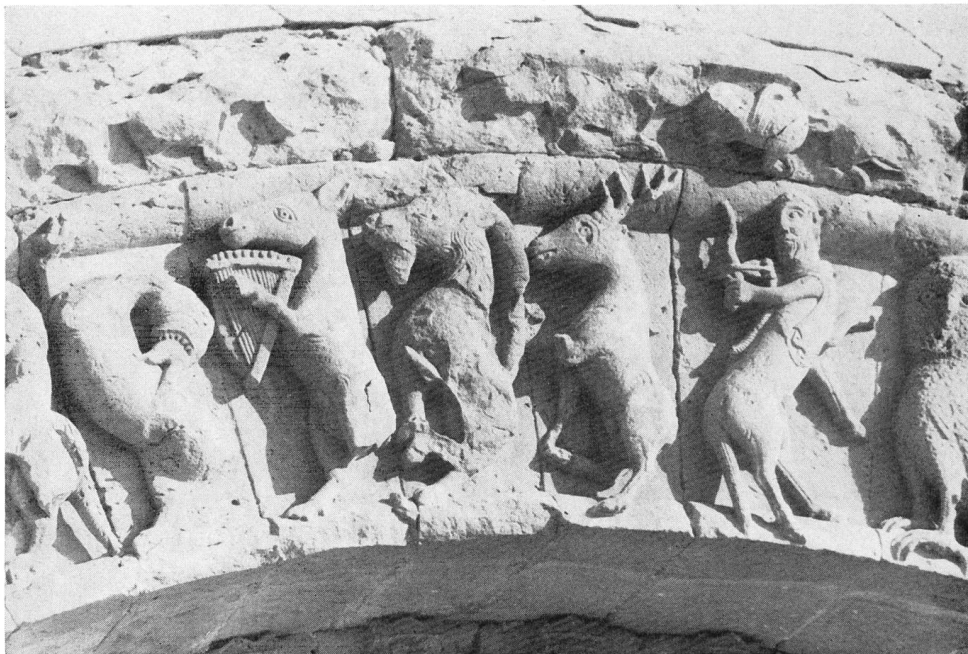
Fig. 27. Bestiaire d'Aulnay. Âne musicien.