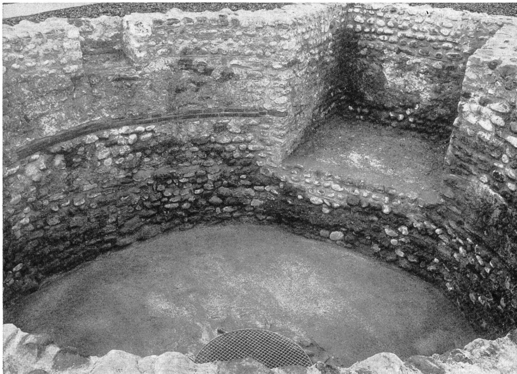
Abb. 78. Winkel ZH. Das römische Brunnenhaus bei Seeb. Nach der Konservierung im Frühjahr 1964. Aus Nordosten. Blick ins Innere, im Vordergrund der Sodbrunnen.