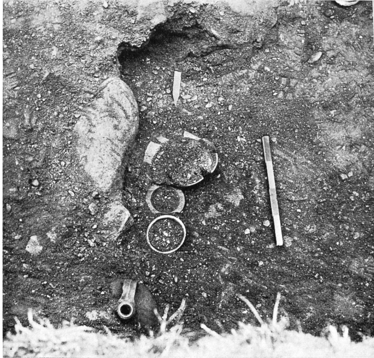
Abb. 40. Roveredo. Grab Nr.1 von Nordosten, während der Freilegung. Pfeil = Rand der Einfüllung mit schwärzlicher Erde, Maßstab = Fundort der 6 Münzen.