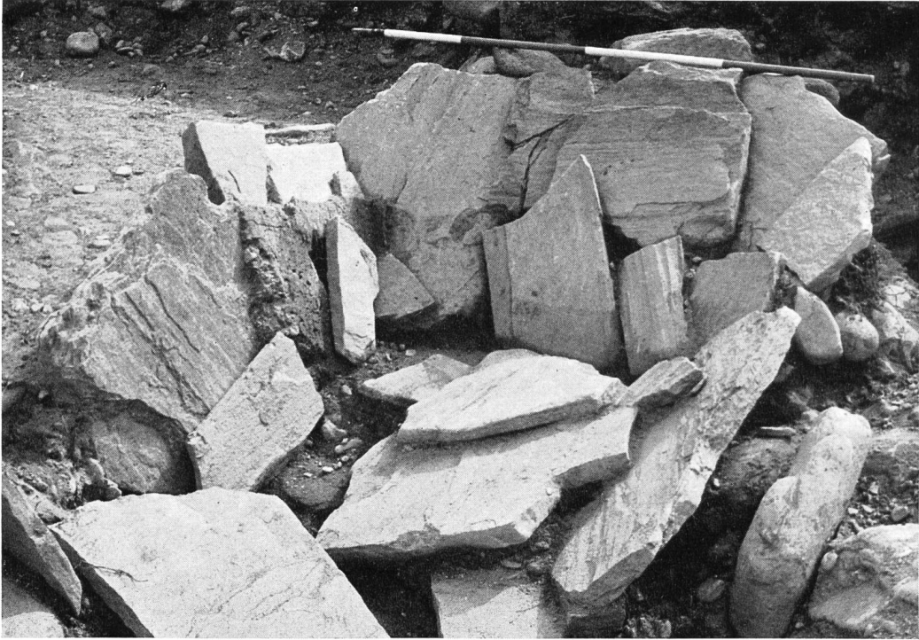
Abb. 45. Roveredo. Grab Nr. 12, ein weiteres Beispiel von Grabraub. Länge der Meßstange 2 m, man beachte die Größe der Anlage.