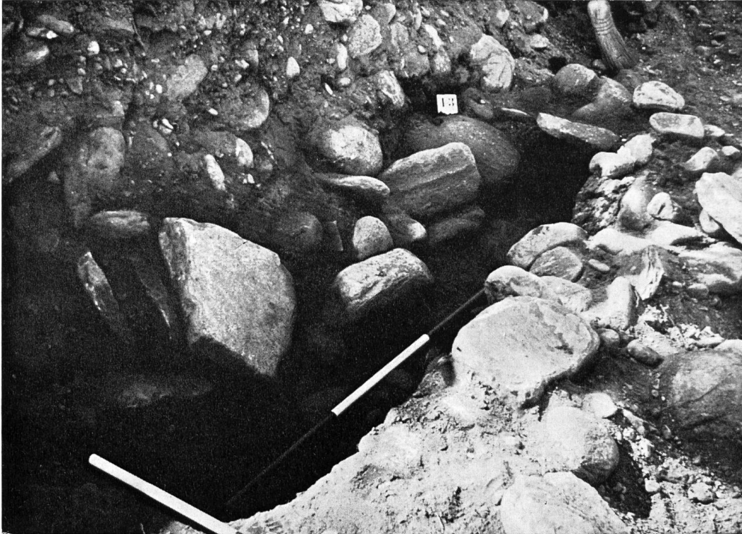
Abb. 43. Roveredo. Inhumationsgrab Nr. 13, von Nordosten gesehen. Die eine Längsseite ist eingestürzt.

etwas vertieft, fünf Gefäße, darunter zwei aus Sigillata. Vom Skelett keine Spur, ebensowenig in Grab Nr. 14, wo die Reste zweier Backenzähne in 50 cm Abstand voneinander entfernt, der eine in der Gürtelgegend, der andere am westlichen Ende, lagen. Die Überreste einer Halskette aus Glasperlen und einigen großen Bernsteinperlen lagen ebenfalls in der Hüftgegend. Es macht den Anschein, als ob auch dieses Grab auf Wertsachen abgesucht worden sei, als der Leichnam längst zerfallen war. Noch deutlicher sind die Spuren der Zerstörung beim Steinkistengrab Nr. 7 (Abb. 44). Die Steinplatte rechts ist mitten entzwei geschlagen, Aschen- und verbrannte Knochenreste liegen in die eine Ecke zusammengeschart mit den Resten eines Gefäßes da. Auf der Photographie sind die Steinwurzeln sichtbar, die sich in die meisten Gräber hineingesenkt haben, da sie dort statt dem Flußkies einen ganz feinen weichen Sand und organische Überreste vorfanden. Das eindrucklichste Bild von der Zerstörung dieses römischen Gräberfeldes ist in Abb. 45 zu sehen, die zwei Meter im Geviert messenden Platten einer großen Grabkammer. An diesen Platten wurde auch deutlich, daß die antiken Bauleute offenbar größere Blöcke im Flußgeschiebe geschickt in Platten gespalten haben. Das macht wohl die Wahl dieser Stelle für ein Gräberfeld verständlich: Man brauchte bloß einen größeren Block aus dem Flußgeschiebe herauszuheben, ihn in einige Platten zu spalten und die besten davon auf