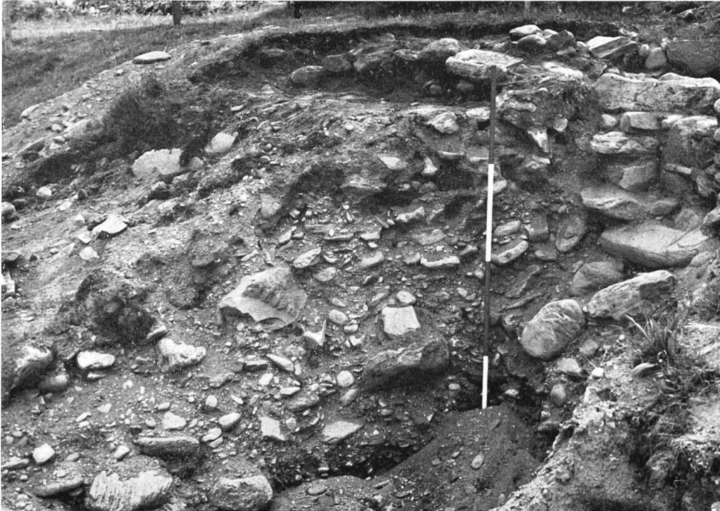
Abb. 39. Roveredo. Die vom Fluß zerstörte Ruine (Mauerabgang oben rechts) in der Böschung, welche die Gräber enthält. Man beachte das Material der Böschung.

hinüber. 1481 richteten die Bewohner von Roveredo ein Ersuchen an Papst Sixtus V., er solle sie vom Kloster S. Vittore unabhängig machen und eine eigene Kirchgemeinde einrichten. Der Fluß Moesa reiße immer wieder die Brücke weg, so daß sie ihren kirchlichen Pflichten nicht nachkommen könnten. So erfahren wir indirekt von einer größeren Überschwemmung, und es wird kein Zufall sein, daß die Misoxer Grafen fünf Jahre später, nämlich 1486, die alte Brücke von Roveredo errichten ließen. Diese wunderschöne alte Brücke wurde ihrerseits 1951 von einem Hochwasser eingerissen. Von der Gewalt dieses Bergflusses macht man sich kaum eine zureichende Vorstellung. Wenn man aber die Berichte der Einwohner und die Chroniken früherer Zeit vergleicht, wird einem auch klar, wie die den Tre Pilastrì benachbarte Ruine, unsere zweite Aufgabe, entstanden ist (vgl. Abb. 39). Am Rande einer Bodenwelle, offenbar einer ehemaligen Flußverbauung, erhebt sich noch heute sichtbar altes Gemäuer mit den Resten eines Tonnengewölbes. Die Ausgrabung zeigte – das war der zweite Punkt –, daß es sich um eine «Cantina», ein ländliches Wirtschaftsgebäude, handeln muß, das durch ein Hochwasser völlig zerstört worden ist. Fünf Meter unterhalb lag noch ein größeres Stück des Tonnengewölbes im Flußgeschiebe. Rechts oben in unserer Abbildung ist ein Stück des zerstörten Mauergevierts zu sehen. Darunter wird das Flußgeschiebe sichtbar, das diesen Damm bildet und die römischen Gräber enthält.