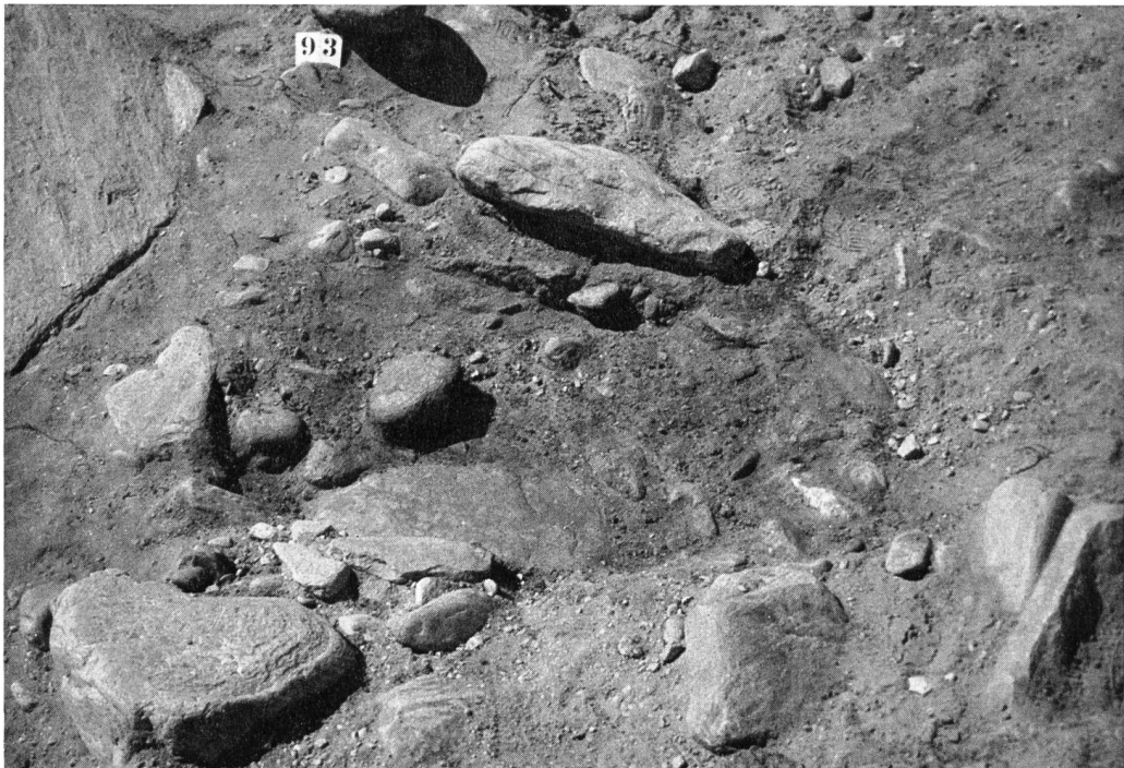
Abb. 46. Roveredo. Kleines Brandgrab Nr. 9, eine flache Mulde, mit Asche und Knochenresten gefüllt, darin drei eiserne Nägel und eine Bogen-Fibel (Abb. 47) aus Eisen, die zuoberst unter der Deckplatte lag.