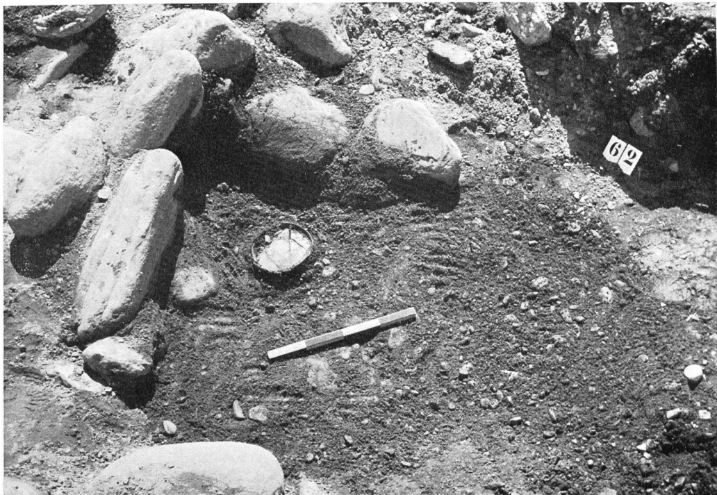
Abb. 42. Roveredo. Grab Nr. 6 nach der Freilegung, Sigillatatteller des L. Gellius in situ; östliches Ende des Inhumationsgrabes.