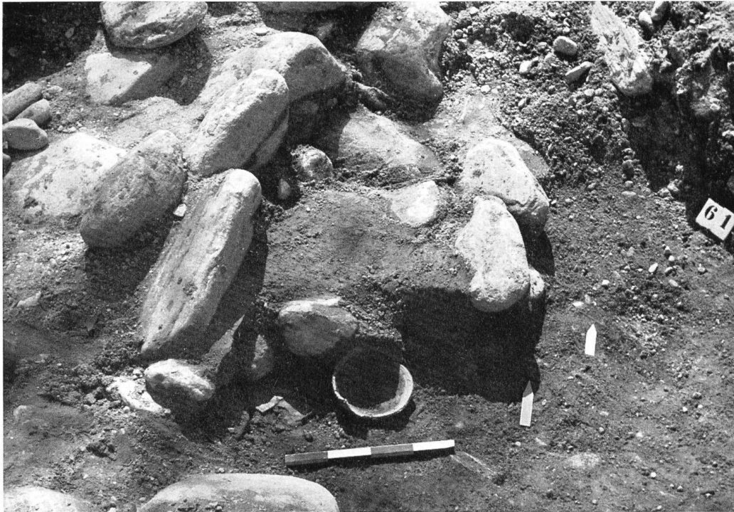
Abb. 41. Roveredo. Grab Nr. 6 von Nordwesten. Der Hohlraum ist mit groben Kieseln ausgefüllt, die auf den Gefäßen liegen. Pfeile: Münze, Bronzefibel (außen rechts).