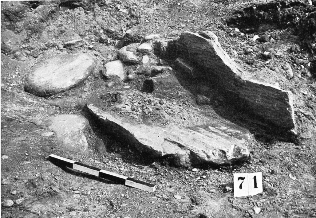
Abb. 44. Roveredo. Steinkistengrab Nr. 7. Asche, Knochenreste und Fragmente eines Tonkruges sind in der einen Ecke zusammengekehrt: Plünderung!

die entstandene Höhlung zu legen. Damit war ein Grab einfachster Art bereits fertig. Unsere Abb. 46 zeigt ein solches Grab, eine flache Mulde von 60 cm größten Durchmessers, nach der Freilegung. In ihr fanden sich bloß eine dicke Schicht von Holzkohle, Leichenbrand und Asche, drei kurze Nägel mit breitem Kopf und eine wunderschöne eiserne Fibel, die zuoberst auflag, unmittelbar unter der Deckplatte (siehe Abb. 47). Von den insgesamt 30 untersuchten Gräbern waren nachweisbar 9 Brandgräber, die inmitten von Körperbestattungen lagen. Beide Grabarten wiesen eindeutig römische Funde auf und sind in die Zeitspanne von 30 bis 120 n. Chr. zu datieren. Sichere Inhumationsgräber fanden wir im ganzen 9. Bei den restlichen Gräbern wird nur eine Untersuchung des Gefäßinhalts und der Grabeinfüllung lehren, ob mikroskopische Spuren von Leichenbrand vorhanden sind. Eine Anzahl Gräber mit schöner Einfassung aus Flußkieseln und Deckplatten waren «beigabenlos». Sind Schmuckstücke daraus entfernt worden, oder handelt es sich wirklich um so arme Glieder der Bevölkerung? Oft war trotz sorgfältiger Beobachtung nicht mehr auszumachen, ob eine Grabplatte wirklich die Vertiefung für ein kleines Skelett (Kindergräber!) oder sonst eine Höhlung überdeckte, in die von beiden Seiten Kiesel nachgerutscht waren. So blieb nichts anderes übrig, als den Nachweis der Gräber auf geochemischem Wege zu versuchen. Wir benützten