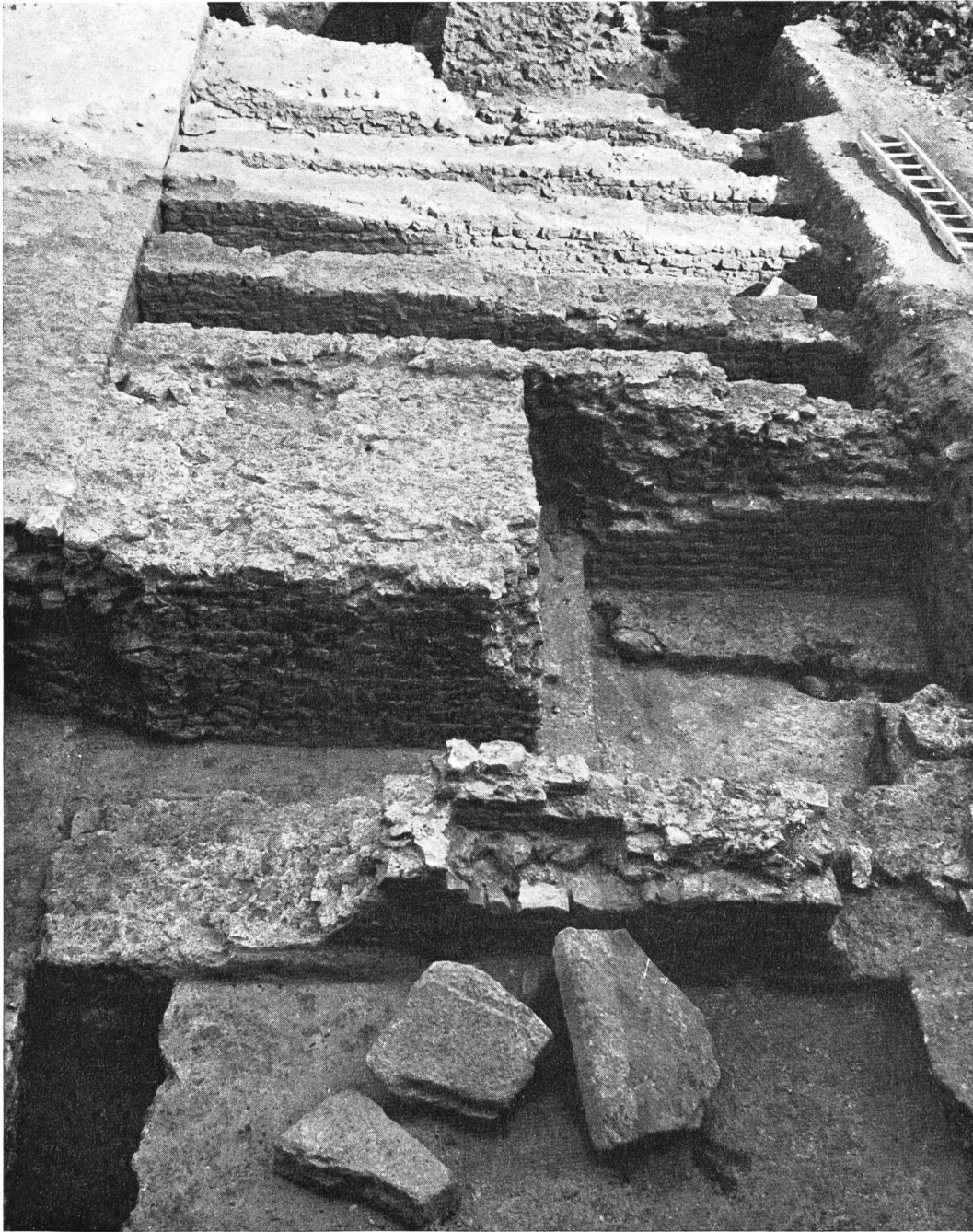
Abb. 9. Avenches, Grange du Dôme, Ostfront des Tempels mit Podien und Treppenfundamenten.