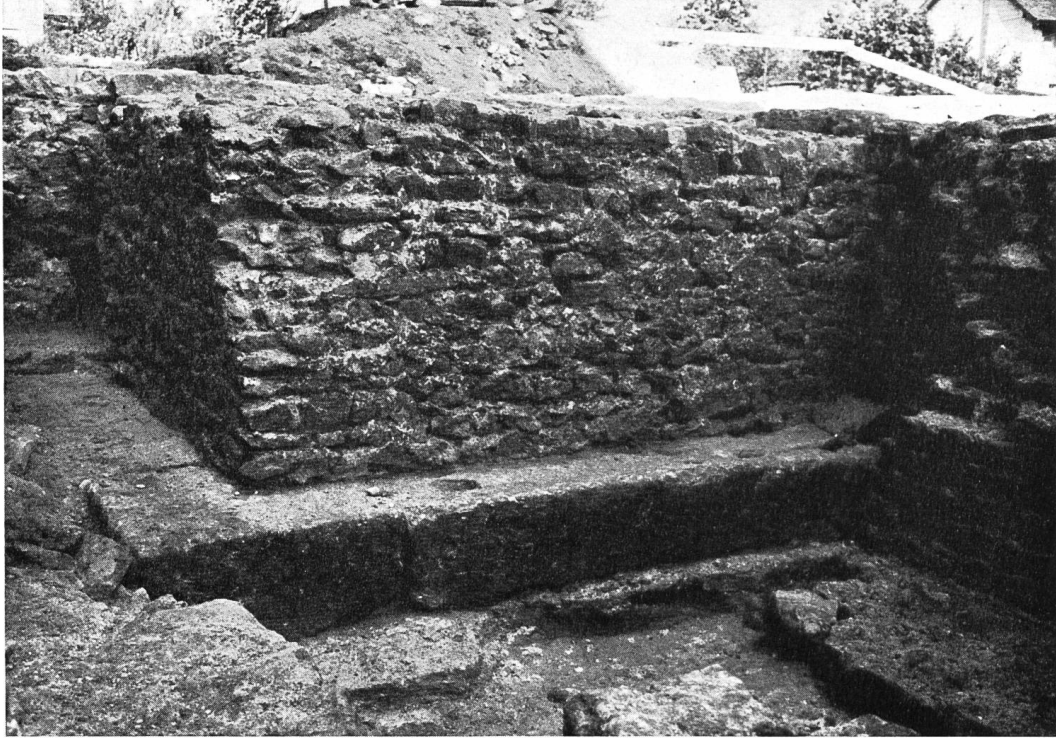
Abb. 10. Avenches, Grange du Dôme. Fundament der ausgebrochenen Verblendung aus Sandsteinquadern.

heimische Überlieferung, die Überhöhung des Bauwerkes spiegelt südländischen Einfluß wider.