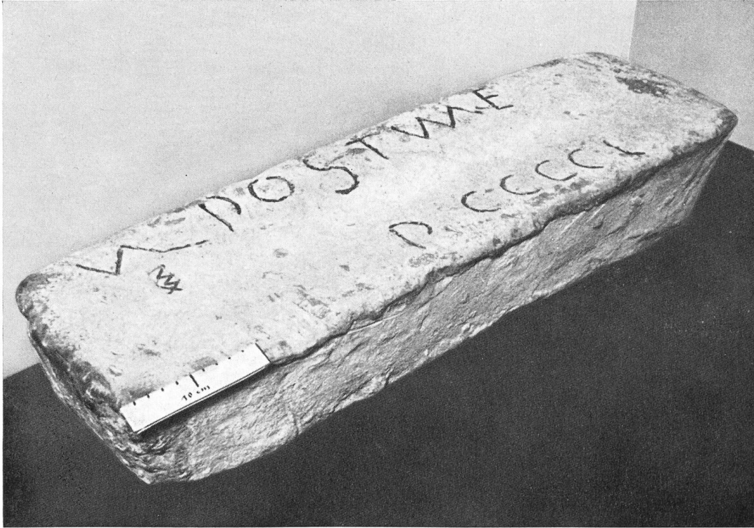
Abb. 13. Arbon. Römischer Bleibarren (Ur-Schweiz XVI, 51).

verneint werden, da die römischen Techniker wußten, daß vielmehr eine gemäßigte Temperatur geeignet war, diese Mischung feiner Riefen und glatter Flächen zu erzeugen und damit einen Barren von maximaler Festigkeit sowie ein günstiges Verhältnis zwischen Gewicht und kubischem Inhalt zu erzielen. Es bleibt die Möglichkeit, daß die Form beim Gießen von einem früheren Guß eines ähnlichen Barrens her noch heiß war, der kurz vorher entfernt worden war. Dies ist eine wichtige Folgerung, weil sie aussagen dürfte, daß der Barren an einem Ort hergestellt wurde, wo die Bleiproduktion in bedeutendem Ausmaß erfolgte und die Schmelzöfen eine beträchtliche Kapazität aufwiesen. Es ist nicht erstaunlich, daß – wie die nun zu besprechende Inschrift zeigen wird – derart wichtige Metallwerke unter militärischer Aufsicht standen.