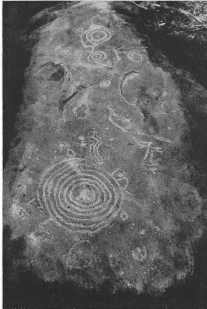
Abb. 4. Sils i. D., Carschenna. Gesamtansicht von Platte V.

am besten, weil sie kein durch Nachzeichnen subjektiv verfälschtes Bild ergibt. Nach mehrmaligem Überpinseln mit dem Gemisch wird der Fels mit einem sauberen Schwamm abgetupft, wobei die Kreide nur noch in den Vertiefungen sitzen bleibt und nachträglich mit Wasser wieder ausgeschwemmt werden kann. Zeichnung und Photographie werden gegenwärtig ergänzt durch großflächige Kunststoffabgüsse mit Gipsform.