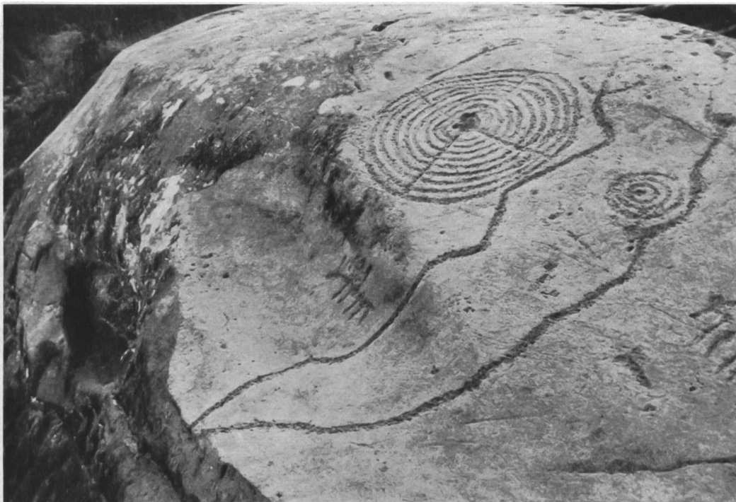
Abb. 3. Sils i. D., Carschenna. Die rundgeschliffene Felskante bei Platte II (man beachte die beiden Reiter).