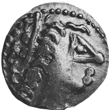
132 Monnaie gauloise en argent du type dit de »Martigny«, trouvée dans le temple gallo-romain.