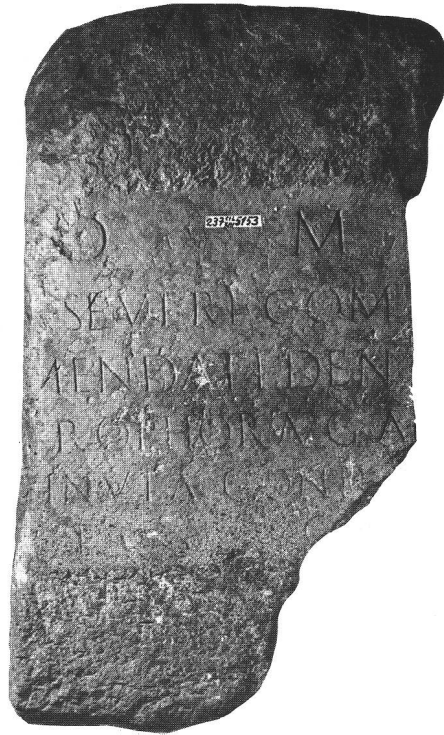
fig. 4 Épithaphe de Severius Commendatus, trouvée à Amsoldingen BE et provenant probablement d'Avenches. Le défunt est sans nul doute un affranchi, membre du collège des dendrophores augustaux chargé d'accomplir pour la sauvegarde de l'Empereur et la prospérité de la communauté les rites du culte de Cybèle. Grabinschrift des Severius Commendatus, gefunden in Amsoldingen BE. Stele di Severius Commendatus, trovata ad Amsoldingen BE.

aux Severii une origine locale. Il s'agit vraisemblablement d'autochtones de race gauloise ; leur romanisation pourrait être ancienne et dater de l'effort de colonisation déployé par César et Auguste ; c'est du moins ce que l'on peut supposer les fortes concentrations de Severii sur les territoires de Nîmes (8) et Lyon (5).