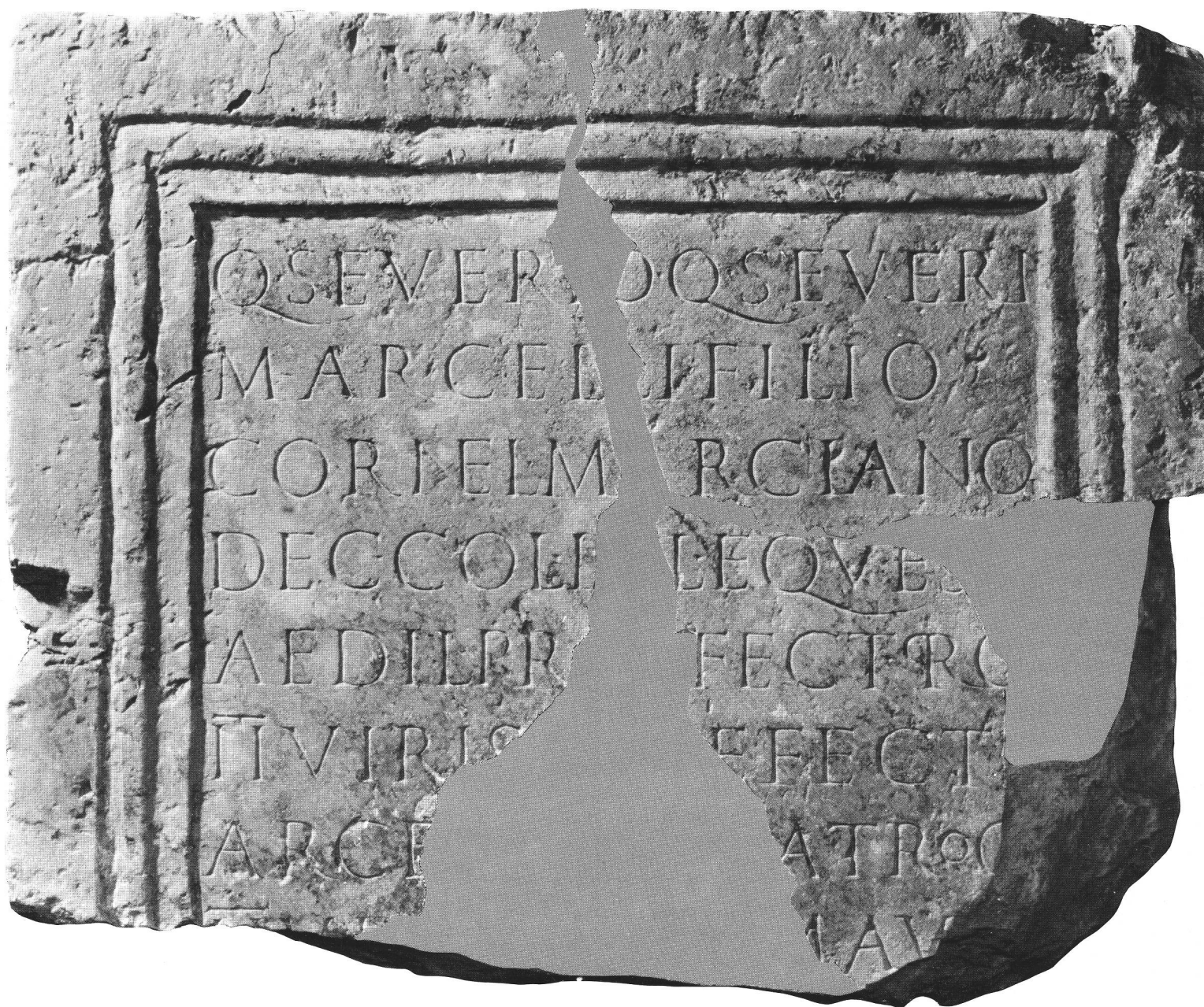
fig. 1 Inscription honorifique à Quintus Severus Marcianus. Ehreninschrift für Quintus Severus Marcianus. Inscrizione d'onore per Quintus Severus Marcianus.