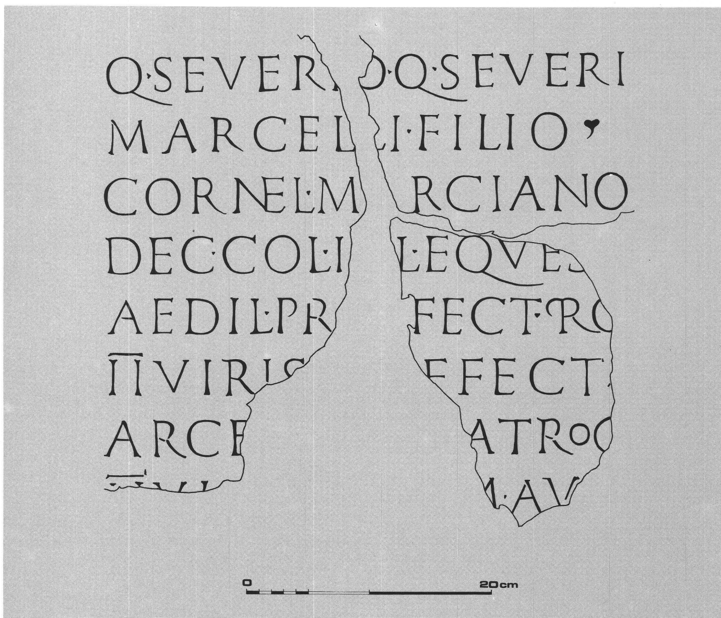
fig. 2 Fac-similé de l'inscription. Faksimile der Inschrift. Facsimile dell'iscrizione.

»A Quintus Severius Marcianus, fils de Quintus Severius Marcellus, de la tribu Cornelia, décurion de la Colonia Julia Equestris, édile, préfet remplaçant les duumvirs, préfet à la répression du brigandage, duumvir..., flamine d'Auguste,...«