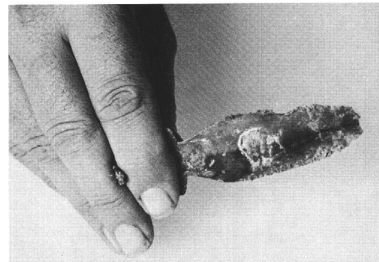
Abb. 3 Wie das Rasiermesser von Maladers gehalten wird. Comment on tenait le rasoir de Maladers. Come si teneva il rasoio di Maladers.