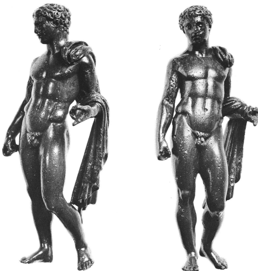
Abb. 2-6 Der Merkur von Maladers in verschiedenen Ansichten. M. 1:1. Différentes vues du Mercure de Maladers. Varie vedute del Mercurio di Maladers.

jedoch demütig gesenkt ist. Der aus mehreren Repliken rekonstruierte bronzene Speerträger in München ist in seiner rechten Körperseite mit unserer Statuette (Abb. 4-6) fast identisch 8 . Deutlich geht aus diesen Ansichten die Lage der Lanze oder des Kerykeions hervor, die parallel zum rechten hängenden Arm im linken Arm gelegen haben. Vom Doryphoros weichen dagegen die zurückgenommene linke Schulter des Merkur und die Position des linken Armes ab, der weniger angehoben ist und dessen Unterarm für den leichten Heroldsstab weniger kraftvoll wirkt als die lanzenhaltende Linke des Doryphoros. Auch ist die Körperoberfläche des Merkur zarter und grossflächiger modelliert als jene des Speerträgers. Die zurückgenommene linke Schulter und das gesenkte Haupt sind vom »Diskophoros« oder vom spendenden Jüngling, wie dieses Werk von Poly-