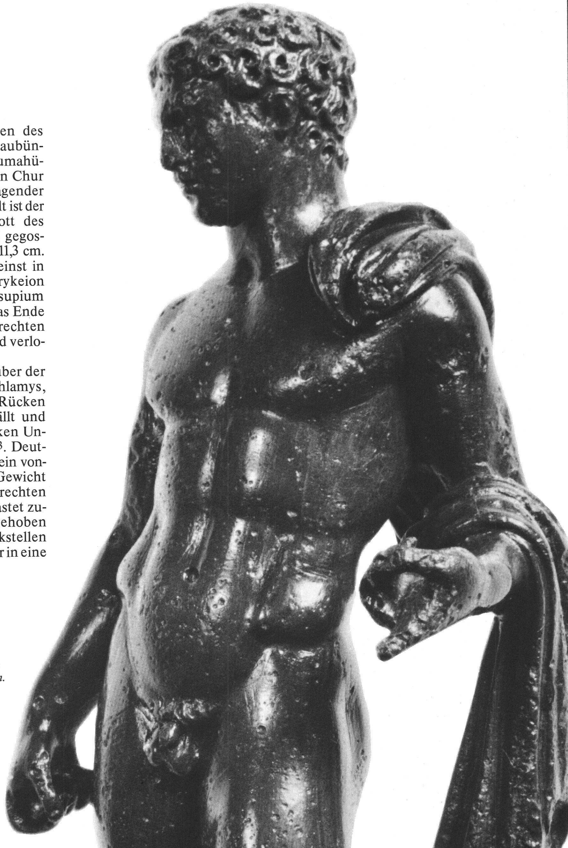
Abb. 1 Vergrößerter Oberkörper des Merkur von Maladers. Torse du Mercure de Maladers agrandi. Torso ingrandito del Mercurio di Maladers.

Merkur ist unbekleidet, nur über der linken Schulter trägt er eine Chlamys, die in breiten Falten über den Rücken und den linken Unterarm fällt und mit einem Zipfel bis zum linken Unterschenkel reicht (Abb. 2.6) 3 . Deutlich werden Stand- und Spielbein voneinander geschieden. Das Gewicht des Körpers ruht auf dem rechten Bein, während das linke entlastet zurückgestellt und der Fuss abgehoben ist. Durch das starke Zurückstellen des Spielbeines gerät die Figur in eine