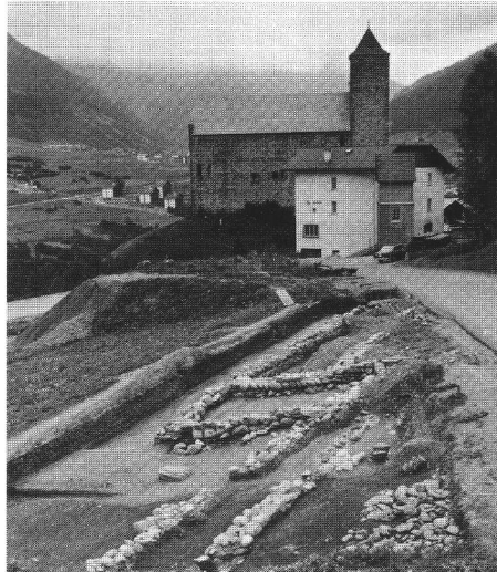
Abb. 1 Riom 1975, Römische Gebäudereste; im Hintergrund die Burg von Riom. Riom 1975, vestiges de bâtiments romains; à l'arrière plan, le château fort de Riom. Riom 1975, resti di edifici romani, nello sfondo il castello di Riom.

Die neuen archäologischen Untersuchungen erbrachten im östlichen Teil des Areals (auf Plan Grabung 1980) einen mächtigen Gebäudekomplex von ca. 30 x 19,5 m Ausmass (Abb. 2), wohl ein Hauptgebäude der römischen Anlage. Dieser Gebäudekomplex wies sowohl auf seiner Ostseite als auch auf der Westseite je einen langgezogenen, portikusartigen Raum auf. Der östliche Langraum, der relativ stark in den Kiesabhang eingetieft war, besass eine Raumunterteilung, nämlich eine zweiphasige Mauer. Im nördlichen Bereich des Raumes fanden sich Reste eines verkohlten Holzbretterbodens, der ursprünglich auf dem Vorfundament auflag und der auch ein Hinweis darauf ist, dass das Gebäude abbrannte (Abb. 3). Im südlichen Teil des Gebäudes kamen unter Mauerversturz und Bauschutt unzählige Fragmente einer Wandmale-