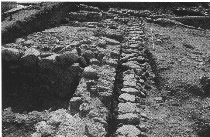
Abb. 7 Riom 1981, mit Steinplatten abgedeckter Abwasserkanal, links davon Nebengebäude mit Hypokaust. Riom 1981, égout recouvert de dalles de pierre; à gauche, une annexe avec un hypocauste. Riom 1981, fogna coperta con lastre di pietra, a sinistra edificio annesso con ipocausto.