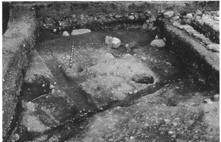
Abb. 6 Riom 1981, Balkenlager und Unterlagsplatten eines frühkaiserzeitlichen Holzbaus. Riom 1981, emplacement de poutres et dalles en pierre de fond d'une construction en bois du début de l'époque romaine. Riom 1981, travi e lastre di un edificio di legno dell'impero antico.