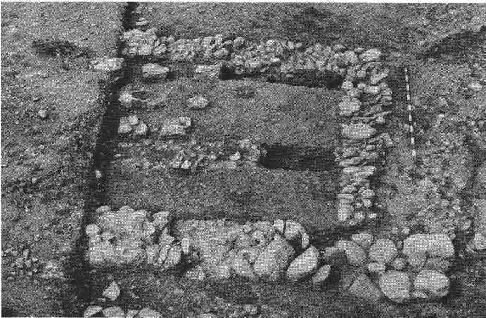
Abb. 5 Riom 1980, Teil einer Hypokaustanlage. Riom 1980, partie d'un hypocauste. Riom 1980, parte di un ipocausto.