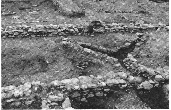
Abb. 4 Riom 1980, Gebäudekomplex mit Kanalheizung. Riom 1980, bâtiment avec un chauffage par canal. Riom 1980, complesso di edifici con riscaldamento a canale.