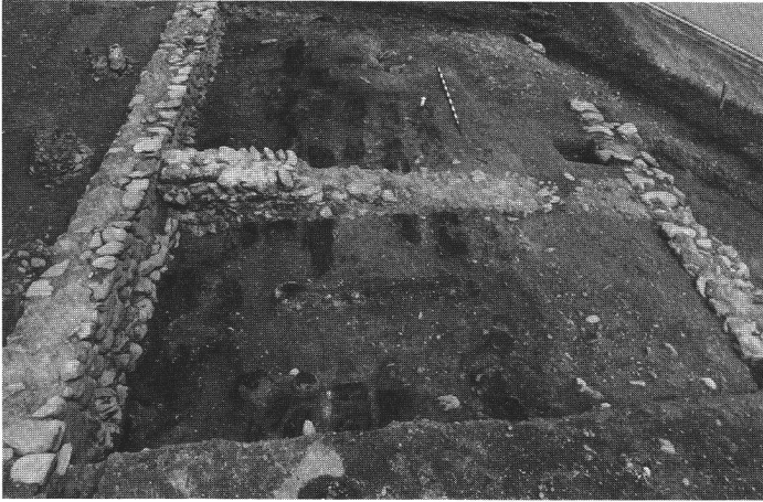
Abb. 3 Riom 1980, Gebäudekomplex mit Überresten eines verkohlten Bretterbodens. Riom 1980, bâtiment avec restes d'un plancher brûlé. Riom 1980, complesso di edifici con i resti di un pavimento di legno carbonizzato.