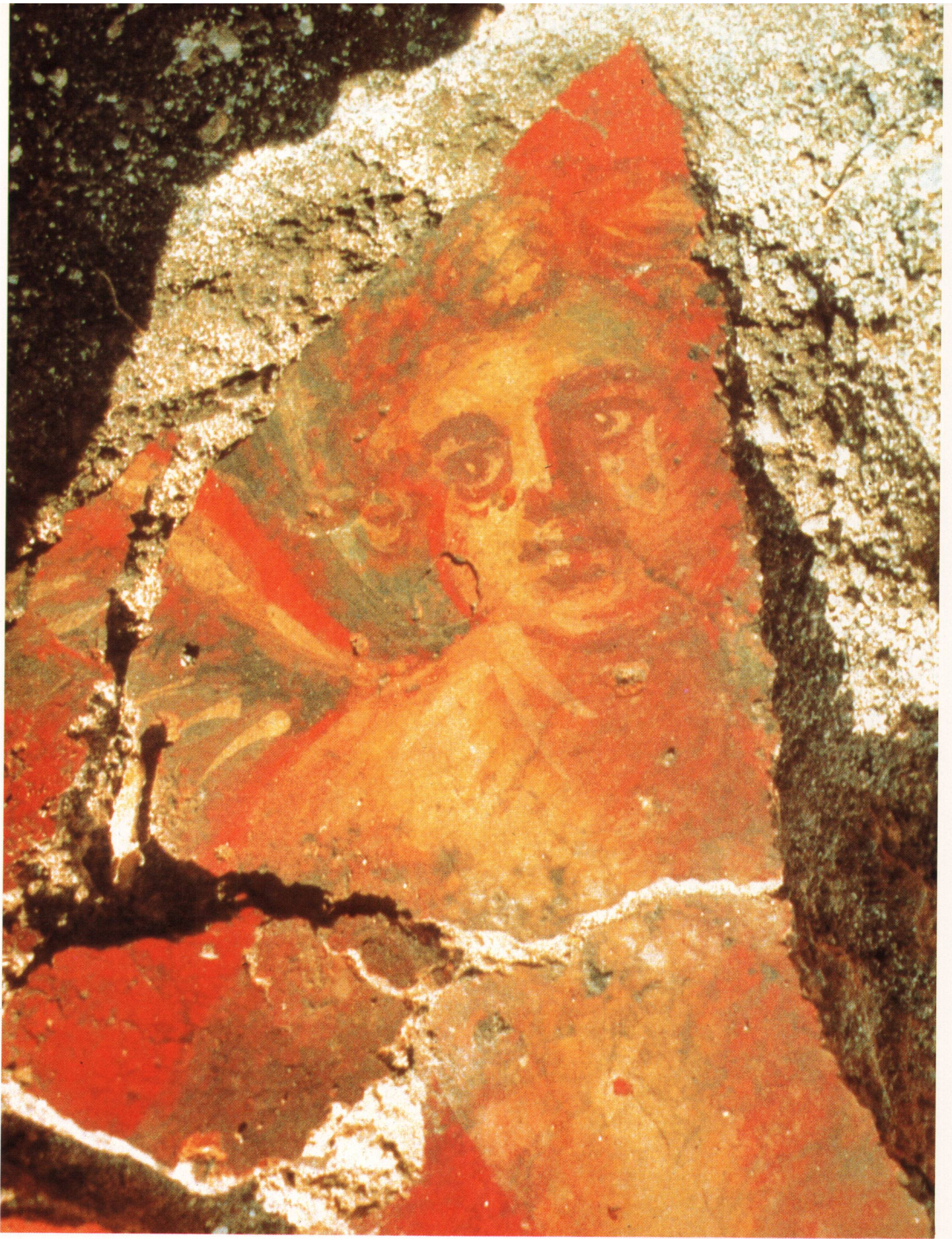
Riom 1980, Römische Wandmalerei mit Darstellung eines Amors. Riom 1980, peinture murale romaine avec représentation d'un Amour. Riom 1980, pittura murale romana con Amor.