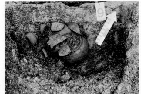
Eines der Gräber im Schnitt. In der Mitte die Urne, die den Leichenbrand enthält.