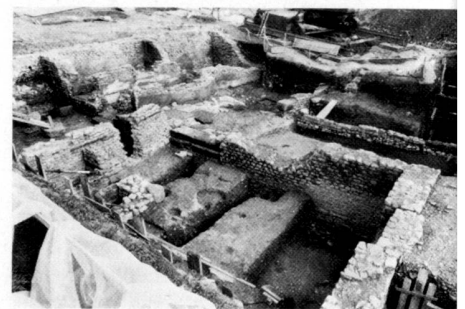
Grabung Schmidmatt, Ostteil.