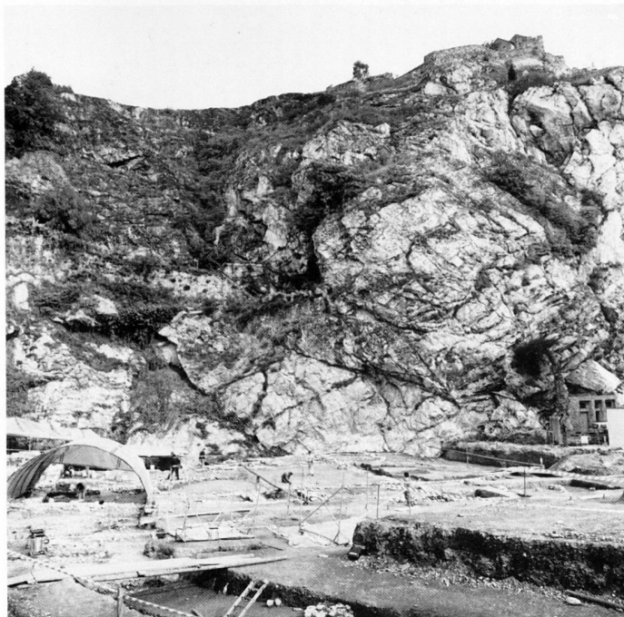
fig. 2 Le site vu du sud: l'extrémité occidentale de la falaise de Valère domine le gisement préhistorique (abri de chantier à l'arrière-plan à gauche) et les vestiges de l'église. Blick von Süden auf die Grabungsstelle; links die prähistorischen Siedlungsreste und die frühmittelalterliche Kirche. Il sito visto da sud: l'estremità occidentale del precipizio di Valère domina il sito preistorico e le vestigia della chiesa.