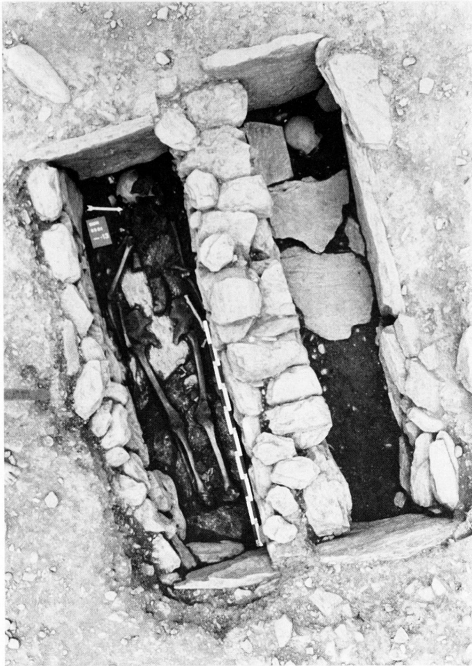
fig. 6 Cimetière L, rangée est: la sépulture double, avec le corps sud en place (tombe no 13). Doppelbestattung mit Skelett in situ (Grab 13). Tomba doppia con il corpo sud in situ (tomba 13).