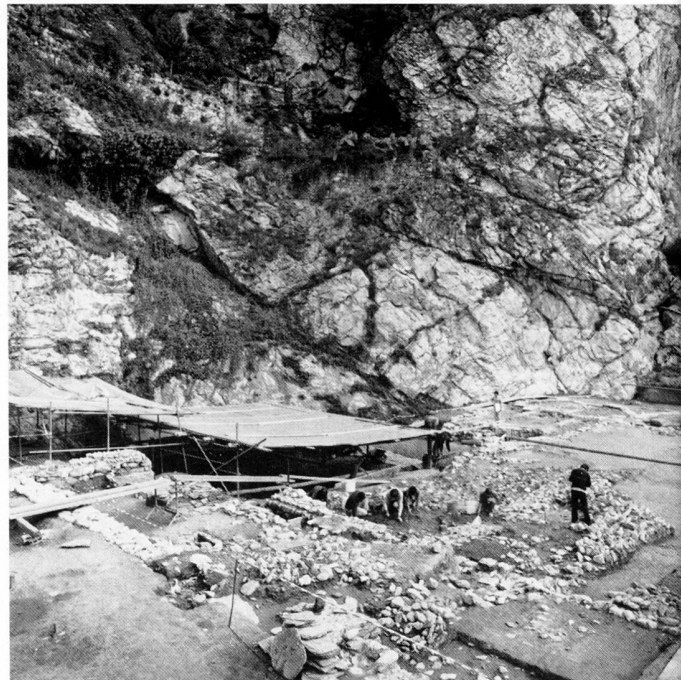
fig. 3 Le chantier vu du sud-ouest: au premier plan le couloir A, puis la zone occidentale de la nef avec le mur renversé (en cours d'exploration). Blick von Südwesten auf die Kirche: Im Vordergrund der Gang A, dann das Westwerk mit der umgestürzten Mauer. Il cantiere da sud-ovest: in primo piano il corridoio A, segue la zona occidentale della nave con il muro crollato (in corso d'esplorazione).

prévoyance et de retraite. Les renseignements acquis au cours de la campagne de 1984 permettront d'aborder avec plus de sécurité l'étude intérieure du bâtiment et celle des phases successives de sa construction. Laissant M. le prof. Gallay exposer ci-après les résultats relatifs à la préhistoire, nous présentons un premier aperçu de l'église et de son environnement immédiat, »sous-produit« de ses recherches.