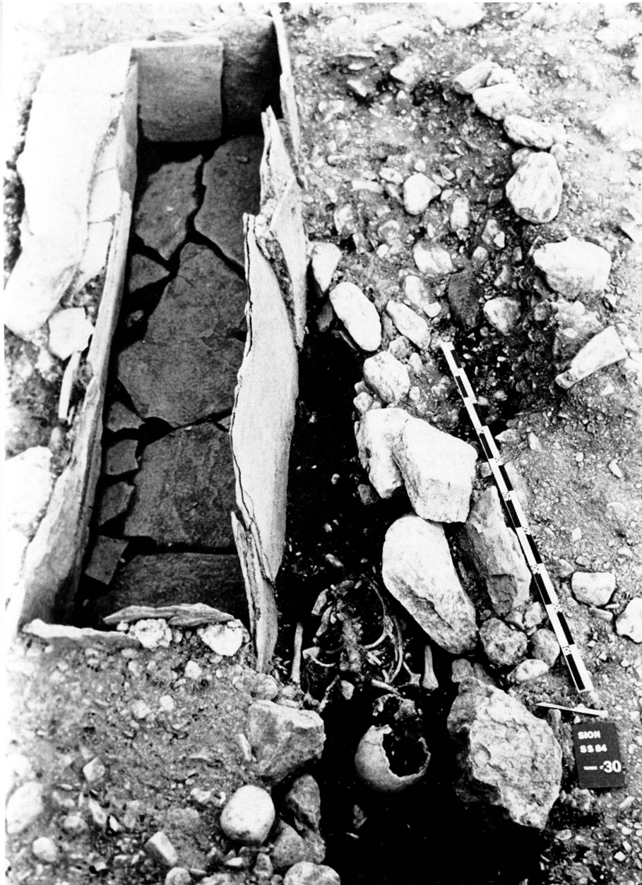
fig. 8 Cimetière L, rangée ouest: un sarcophage de dalles coupe une sépulture plus ancienne (no 30, à coffre de bois?). Ein Steinplattengrab stört eine ältere Bestattung (Grab 30; in Holzarg?). Un sarcofago di lastre taglia una tomba più antica (no 30, con cassa di legno?).

cement de la basilique sans aucune protection. Si le sanctuaire avait encore existé et rempli quelque autre fonction conforme à l'esprit du temps, on l'aurait sans peine englobé dans les fortifications en allongeant peu leur périmètre.