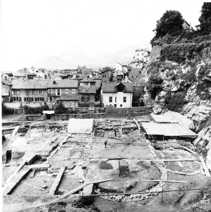
fig. 4 Le chantier vu de l'est: au premier plan, de droite à gauche, les absides D, C et E; au centre, la nef B (travail de relevé et de dégagement); sur la droite, l'abri des préhistoriens et sur la gauche, le cimetière en cours de fouille; au pied du rocher (au fond) restes de l'enceinte urbaine du XIe/XIIe siècle. Blick von Osten auf die Kirchen-grabung: Im Vordergrund die Absiden D, C und E; in der Mitte das

Schiff B; rechts die prähistorische Fundstelle und links ein Blick auf die Gräber. Im Hintergrund Reste der Stadtmauer des 11./12. Jahrhunderts.