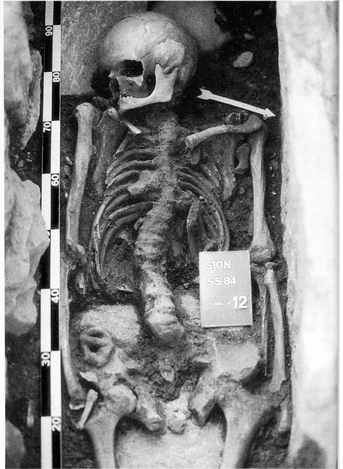
fig. 7 Cimetière L, rangée est: corps (no 12, avec boucle de fer) de la sépulture double. Grab 12 mit eiserner Gürtelschnalle. Corpo (no 12 con fibbia di ferro) della tomba doppia.

142 tance que l'on accordait au sanctuaire: on tient non seulement à augmenter sa capacité d'accueil mais encore à l'adapter à l'évolution des formes liturgiques. Les quelques objets découverts dans les tombes du couloir transversal peuvent être attribués au dernier quart du VI e siècle ou au premier du VII e . Les tombes fouillées au sud de l'église pourraient remonter au VI e et au VII e siècle. Certaines des maçonneries relativement tardives ne paraissent pas antérieures au VIII e ou au IX e siècle. Enfin, l'église ne présente pas de traces de transformations postérieures au premier millénaire. On peut ainsi, en attendant les données plus précises que fournira sans doute la suite des fouilles, admettre qu'une église existait là depuis la seconde moitié du VI e siècle au plus tard, et qu'elle a vraisemblable-