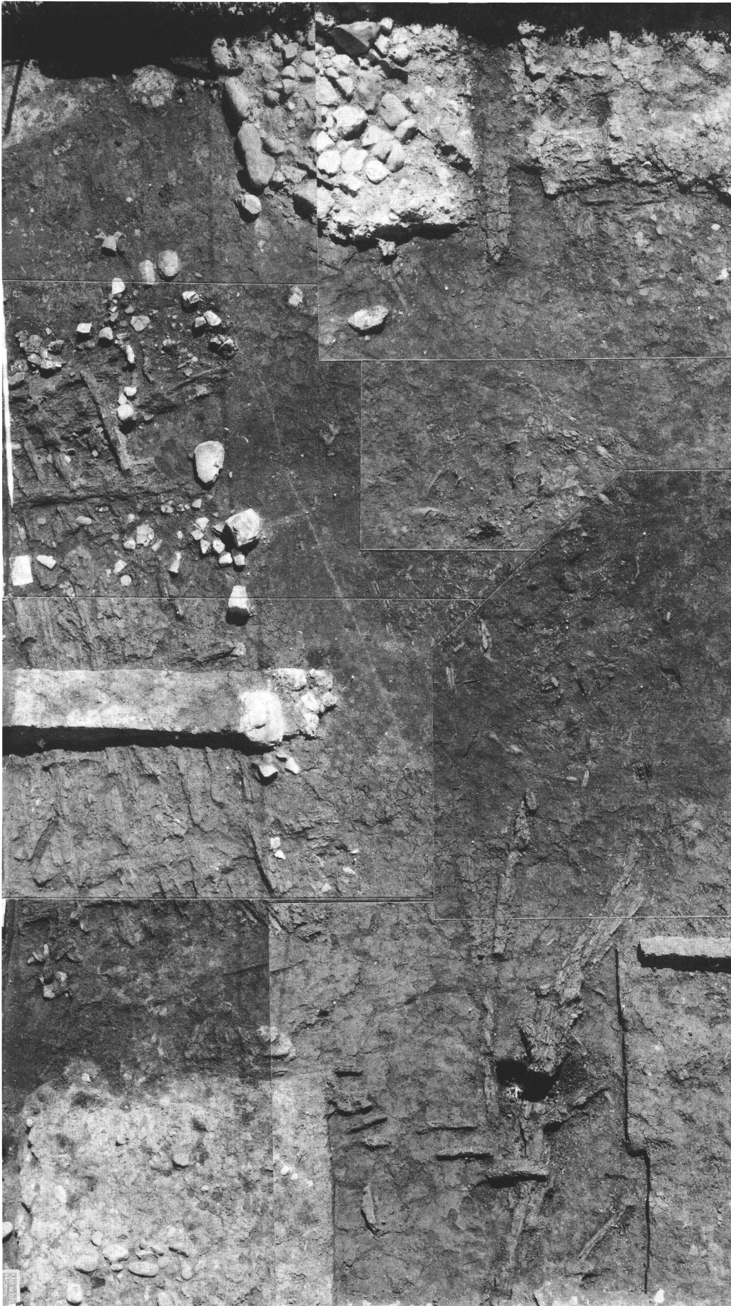
Abb. 3 Blick von Westen auf die 2. und 3. Häuserzeile. Bildrand links: Grundrisse dreier angeschnittener Bauten. Les 2e et 3e rangées de maisons, vues de l'Ouest. Vista da ovest sulle file di edifici 2 e 3.