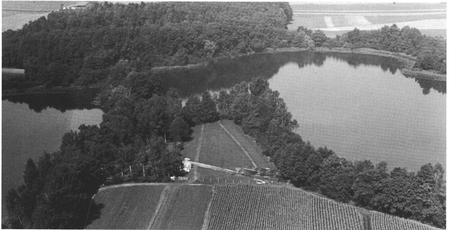
Abb. 1 Uerschhausen/Horn. Nussbaumersee mit Halbinsel und Grabungsfläche 1970. Uerschhausen/Horn. Le Nussbaumersee avec la péninsule et l'emprise des fouilles de 1970. Uerschhausen/Horn. Nussbaumersee con penisola e area degli scavi 1970.