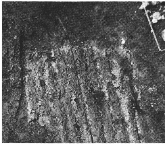
Abb. 4 Herdstelle nach Entfernen der Lehm-Steinpackung. Un foyer, après enlèvement des chapes d'argile et de pierres. Focolare dopo lo sgombro dello strato di pietre e d'argilla.

Die 1985 zusätzlich untersuchte Siedlungsfläche von rund 250m 2 erlaubt bereits, einige weitgehende Rückschlüsse auf die einstige Dorfstruktur zu ziehen. Danach scheint sich abzuzeichnen, dass die Siedlung konsequent in ost-west orientierte Häuserzeilen gegliedert war. Wie bereits anlässlich der Sondierung 1970 zu erkennen war, lagen die beiden nördlichen Zeilen (Abb. 2), einen minimalen Zwischenraum freilassend, dicht nebeneinander. Da zwischen den einzelnen Häusern ebenfalls kaum benutzbare Durchgänge vorhanden waren, ist anzunehmen, dass sich die jeweiligen Hauseingänge auf der Nord- bzw. auf der Südseite befunden haben müssen. Einen grösseren, bis zu 1m breiten Zwischenraum spart hingegen die dritte, südlich gelegene Häuserzeile aus (Abb. 2 und 3). Wenigstens für zwei der nachgewiesenen grösseren