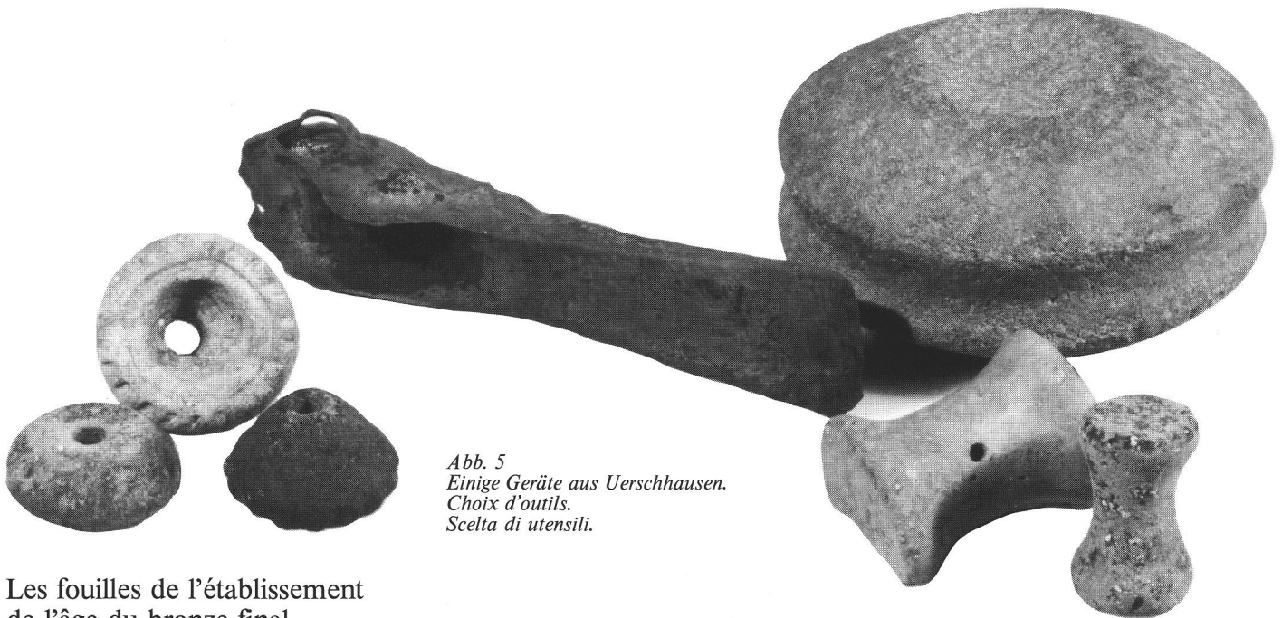
Abb. 5 Einige Geräte aus Uerschhausen. Choix d'outils. Scelta di utensili.

1 M. Sitterding, Eine spätbronzezeitliche Siedlung am Nussbaumersee. HA 9, 1972, 13 ff.