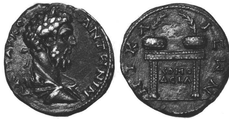
Nikaia, Bithynien Vorderseite: Büste des Kaisers Commodus (177-192). Rückseite: Gabentisch mit zwei Preiskronen und Palmzweigen für die Sieger. Bronzemünze, geprägt 188 n.Chr., anlässlich der Festspiele in Nikaia.

Die Ausstellung dauert bis zum 1. Mai 1988.