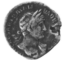
Denar des Hadrian, Einzelfund aus Müllheim TG, 1943/44. (RIC 96b; 2.95 g; 195°; 18,2 mm).