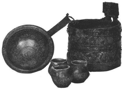
Funde aus einem reichen alamannischen Frauengrab von Güttingen.

Öffnungszeiten des Hegau-Museums: Dienstag bis Samstag von 14 bis 18 Uhr, Sonntag von 14 bis 17 Uhr, Montag geschlossen. Führungen für Gruppen sind auch ausserhalb der Öffnungszeiten nach Voranmeldung möglich.