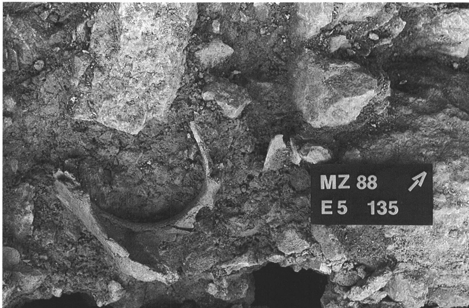
Couche 5, bassin de cheval in situ.