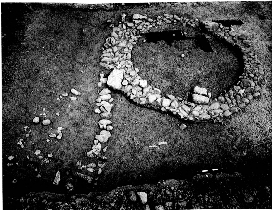
Der Steinkreis der römischen Fundstelle auf dem Blattenacker in Breitenbach.

Hanspeter Spycher Kantonsarchäologie Solothurn