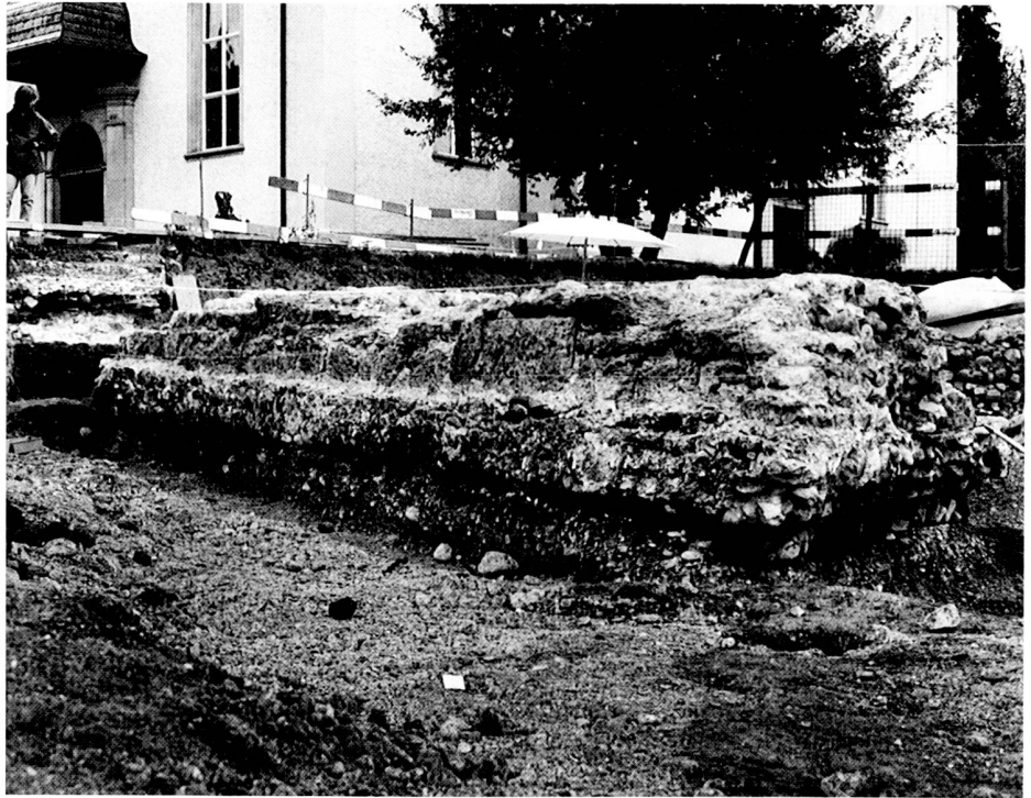
fig. 1 Portion du mur d'enceinte du castel accompagné de ses fondations.