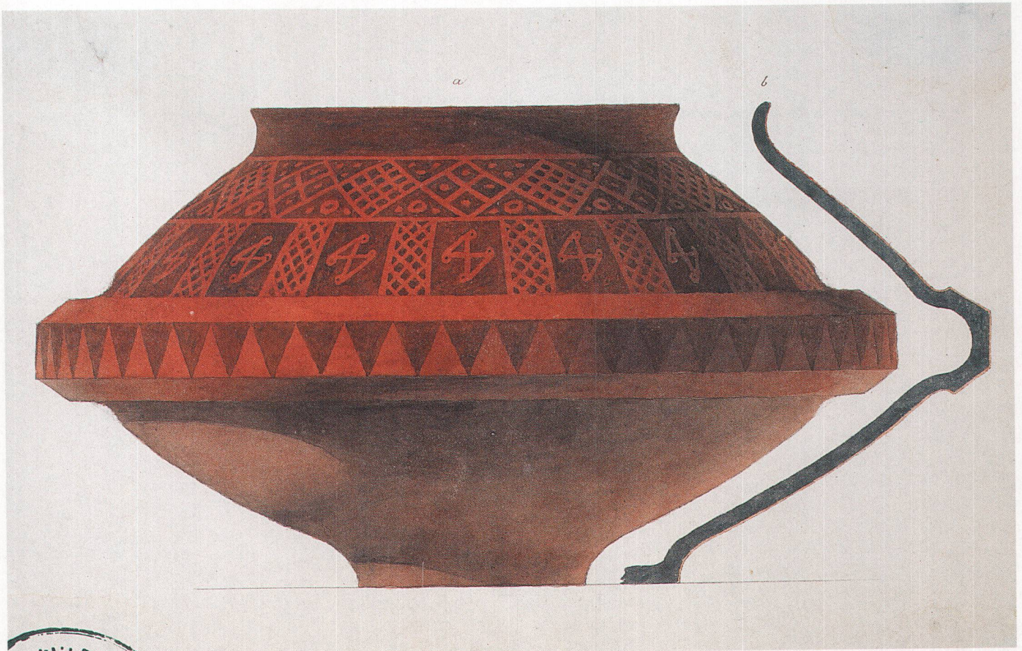
Abb. 5 Ein rotbemaltes Gefäss mit geometrischer Verzierung aus einem der Grabhügel.