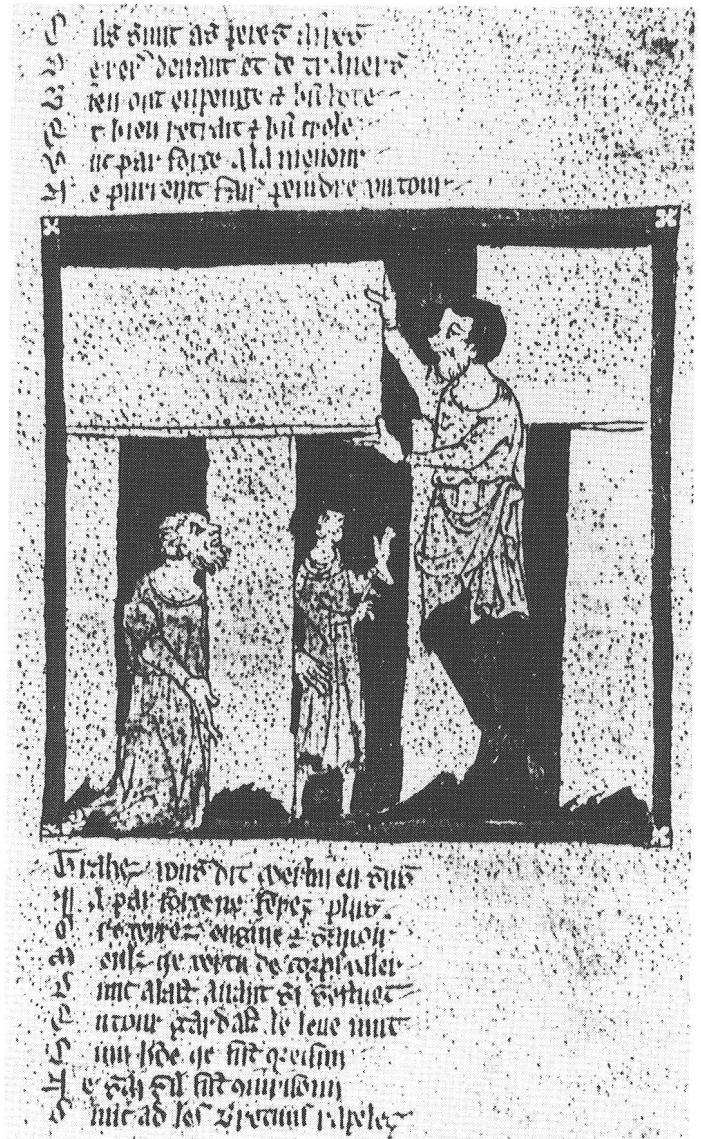
Abb. 3 Merlin baut Stonehenge. Manuskript aus der Mitte des 14. Jahrhunderts. Nach S. Piggott, Ruins in a Landscape (1976). L'enchanteur Merlin construit Stonehenge. Merlino costruisce Stonehenge.

zeln einsetzte. In der volkstümlichen Überlieferung, der »Folk-lore«, glaubte man uralte, getreu bewahrte Berichte und Weisheiten zu entdecken. Da nun Sagen aus dem Artus-Kreis sowohl in Wales als auch in der Bretagne zu finden waren, wurden sie als höchst willkommene Bereicherung keltischer Geschichte eingesetzt. Der mittelalterliche Ritterkönig Artus seinerseits gewann durch die Rückdatierung in die geheimnisreichen Gefilde keltischer Vorzeit eine Einmaligkeit, die ihm bis heute entsprechende Aufmerksamkeit sichert.