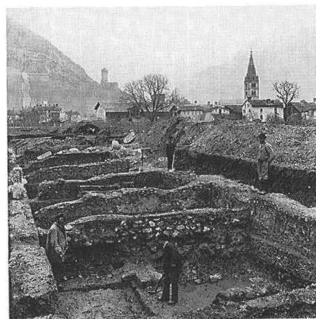
fig. 3 Fouille des boutiques de l'aile nord-est du forum de Martigny/ Forum Claudii Vallensium, du sud-est (début février 1897). Au premier plan, la boutique no. 40. Ausgrabung der Ladenlokale im Nordostflügel des Forums von Martigny im Jahre 1897. Im Vordergrund das Lokal Nr. 40. Lo scavo delle botteghe dell'ala nord-est del foro di Martigny viste da sud-est (inizio febbraio 1897). In primo piano si vede la bottega n. 40.

Pour des raisons indépendantes de sa vocation, le propriétaire du trésor de Martigny, peut-être quelque négociant aisé de la place, n'a pas pu le récupérer pour la plus grande joie des archéologues et des numismates. A notre avis, il est impossible de mettre cet enfouissement en relation avec un événement particulier dont nous aurions connaissance (période d'instabilité politique, guerre, etc.).