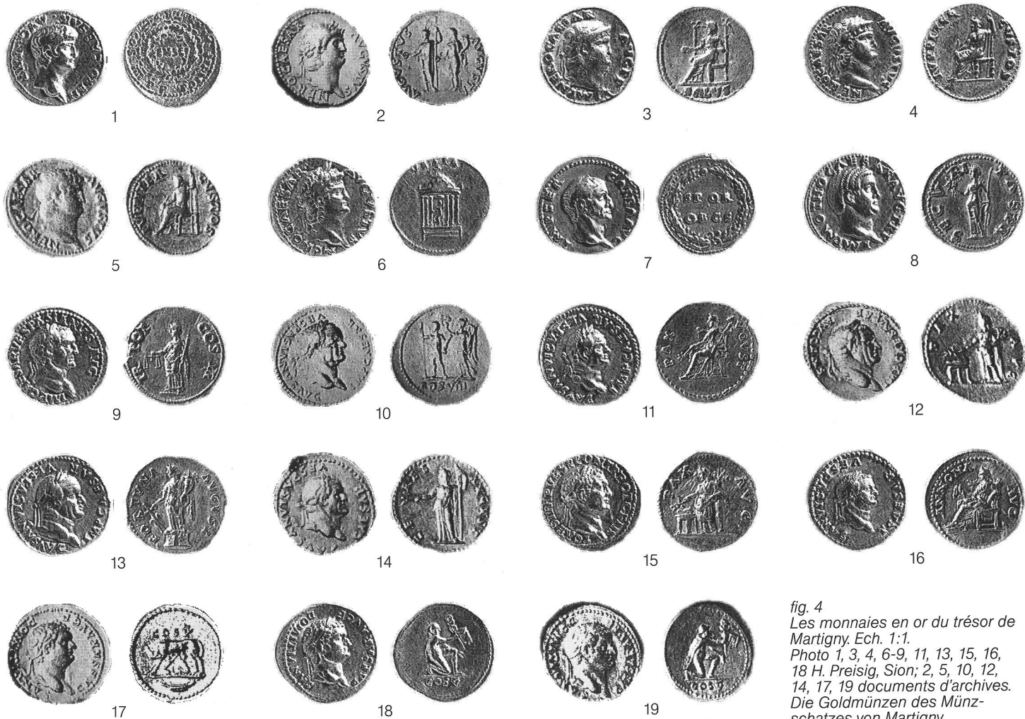
fig. 4 Les monnaies en or du trésor de Martigny. Ech. 1:1. Photo 1, 3, 4, 6-9, 11, 13, 15, 16, 18 H. Preisig, Sion; 2, 5, 10, 12, 14, 17, 19 documents d'archives. Die Goldmünzen des Münzschatzes von Martigny. Le monete del tesoro di aurei di Martigny.

19 Domitien César (sous Vespasien), Rome, 77-78 après J.-C., aureus .