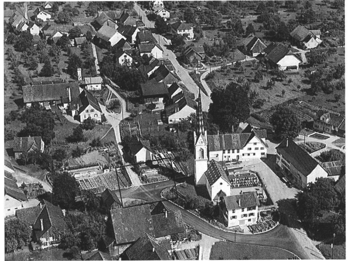
Abb. 1 Flugaufnahme von Hugelshofen kurz nach 1950. Das Haus befand sich im Bereich der neu angelegten Kreuzung links der Kirche. Vue aérienne de Hugelshofen peu après 1950. Fotografia aerea di Hugelshofen poco dopo il 1950.

Der Verwahrfund aus Hugelshofen steht hier auch stellvertretend für eine grosse Anzahl vergleichbarer Funde aus Gebäuden, welche oft übersehen werden oder undokumentiert verschwinden 2 .