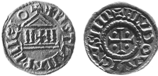
fig. 1 Droit et revers d'un denier de Louis le Pieux, trouvé à Martigny. Cabinet cantonal de Numismatique de Sion (CCNS). Vorder- und Rückseite eines Denars geprägt unter Ludwig dem Frommen, gefunden in Martigny. Diritto e rovescio di un denaro di Luigi il Pio trovato a Martigny.