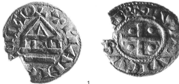
fig. 2 Droits et revers de deniers frappés à l'abbaye de Saint-Maurice, types «anciens». Ech. 2:1. 1 CCNS; 2 Château de Valère VS (1991, fouille en cours); 3 Ferreyres VD (voir note 7). Vorder- und Rückseiten von in der Abtei St-Maurice geprägten Denaren, »älterer« Typ. Diritti e rovesci di alcuni denari di tipo »antico« coniatu nell'abbazia di Saint-Maurice.