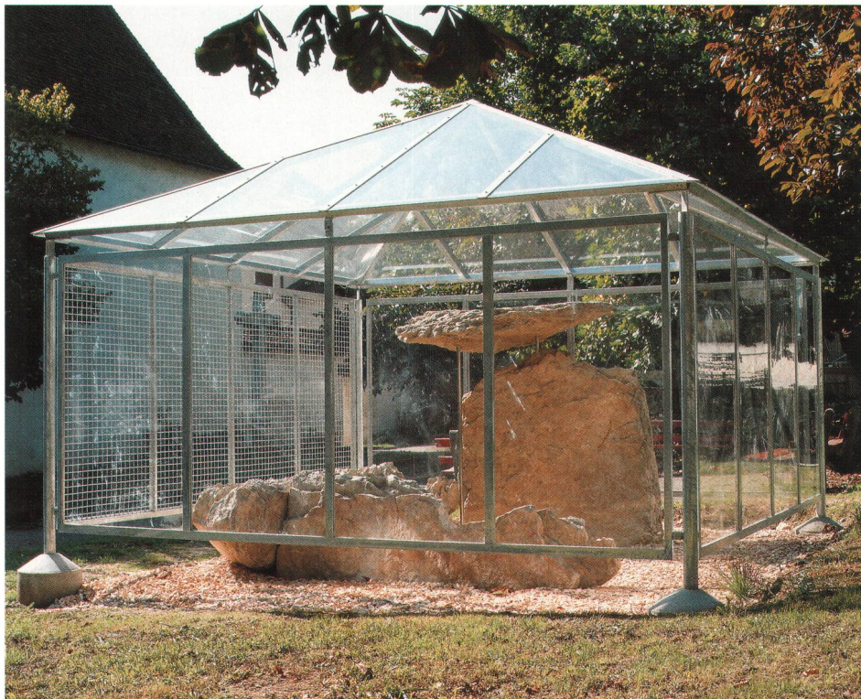
Abb. 1 Das im Park nördlich der St. Katharinen-Kirche in Laufen unter einem Schutzhaus in rekonstruierter Form (ohne Erdhügel) aufgebaute Dolmengrab. Blickrichtung Westsüdwest. Le dolmen reconstruit (sans tertre) dans le parc au nord de l'église Ste-Catherine à Laufen sous un toit protecteur. La ricostruzione della tomba dolmenica priva di tumulo situata sotto una struttura protettiva nel parco a nord della chiesa delle Caterine a Laufen.

Der Bauvorgang kann folgendermassen rekonstruiert werden: Das enorme Gewicht der einzelnen Kalksteinplatten legt nahe, dass diese – um den Transportweg kurz zu halten – in möglichst geringer Entfernung gebrochen worden sind 2 . Für die Errichtung des Grabmonumentes wurden zunächst die Ost- und die Westplatte in die vorher eingetieften Fundamentgruben eingelassen und mit einer Füllung aus Erde und Bruchsteinen verkeilt. Die Stirnseiten dieser beider Platten waren – wie die besser erhaltene Westplatte zeigt – nach oben leicht verjüngend zugehauen wor-