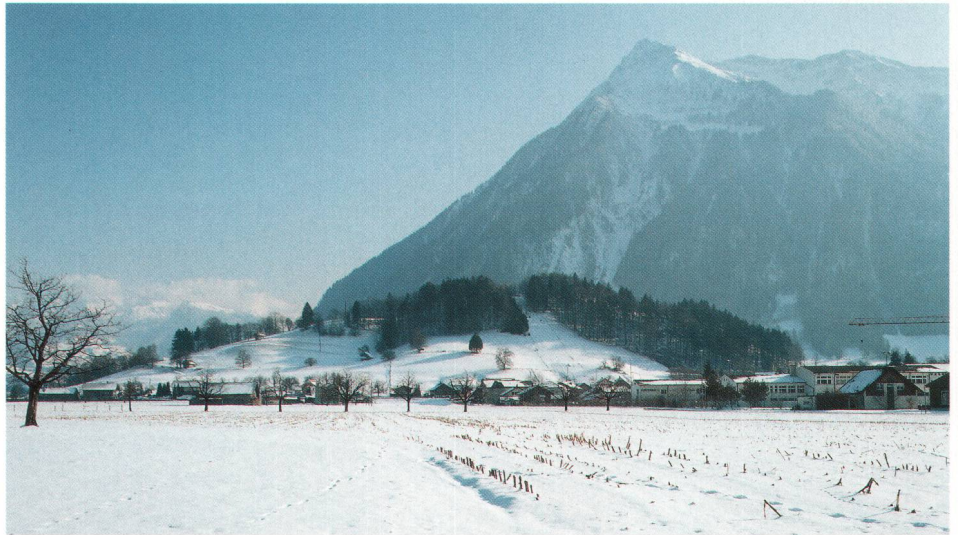
Abb. 1 Der prähistorisch und hochmittelalterlich belegte Pintel (von Nordosten gesehen) dominiert die Eingänge zum Simmental und Kandertal. Im Hintergrund rechts der Niesen. Occupé en temps préhistorique et au Moyen Age le Pintel (vue du nord-est) domine les accès du Simmental et du Kandertal. A l'arrière-plan à droite le Niesen. Pintel, occupato in epoca preistorica e medievale, domina le vie d'accesso al Simmental e al Kandertal (veduta da nord-est).

Der aus anstehendem Liaskalk mit nahezu vertikal in Nord-Süd-Richtung einfallender Schichtung bestehende Pintel überträgt die nacheiszeitlich akkumulierte Schwemmfläche namentlich der Simme unterhalb des Taleinganges um 100 m (Abb. 1). Als dominierender »Schollenberg« am Ausgang des Simmentales gelegen, gleichzeitig den Eingang zum Kandertal westlich flankierend, bietet sich der Pintel gleichermassen an als Ausgangspunkt für die Gewinnung und Nutzung geeigneter Bewirtschaftungs- und Siedlungsareale wie auch für mannigfaltige Passrouten ins Wallis und in den Raum des