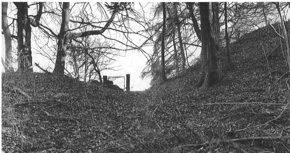
Abb. 7 Der Graben (Abb. 6,5) zwischen prähistorischem »Hauptwerk« (rechts) und rund 3,5 m tiefer gelegenen früh-hochmittelalterlichem »Vorwerk« (links). Le fossé (fig. 6,5) entre la fortification préhistorique principale (à droite) et le promontoire du Moyen Age se situant env. 3,5 m plus bas (à gauche). Il fossato (fig. 6,5), tra la »parte principale« d'epoca preistorica (a destra) e la »parte antistante« del primo alto Medioevo, 3,5 m più in basso (a sinistra).