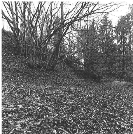
Abb. 8 Das nach Nordosten die Flanke des »Vorwerks« schützende Annäherungshindernis besteht aus umlaufendem Graben mit vorgelagertem Palisadenwall (Abb. 6,6-7) wie sie hochmittelalterlichen Holzburgenanlagen im Mittelland eignen. L'obstacle défendant l'accès et protégeant au nord-est le flanc du promontoire, se compose d'un fossé circulaire et d'un rempart de palissades à l'avant (fig. 6,6-7). Un fossato preceduto da una palizzata protegge un lato delle »strutture antistanti« verso nord-ovest (fig. 6, 6-7).