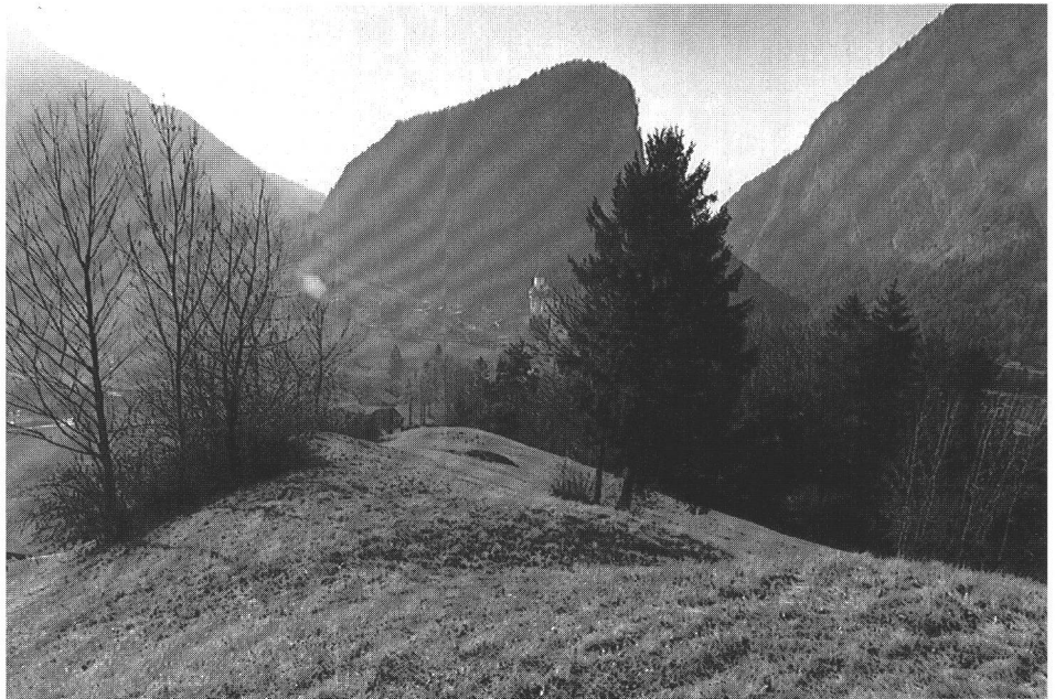
Abb. 3 Nach Südwesten in den Talgrund abfallende Rippe des Pintels mit herausgearbeitetem Graben (Abb. 6,1). La pente escarpée du Pintel vers le sud-ouest dans le fond de la vallée avec un fossé excavé (fig. 6,1). La cresta del Pintel, che scende fino a valle verso sud-ovest, e il fossato (fig. 6,1).

Das 40 m lange und maximal 10 m breite »Hauptwerk« kann unschwer im höchstgelegenen Teil des Rippenrückens gefasst werden. Der felsige Untergrund mit seinen Steillagen und die einwirkende Erosion erlauben uns allein in Scheitellagen auf Ansätze zu ehemals vorhandenen fortifikatorischen Systemen hinzuweisen: Im aus