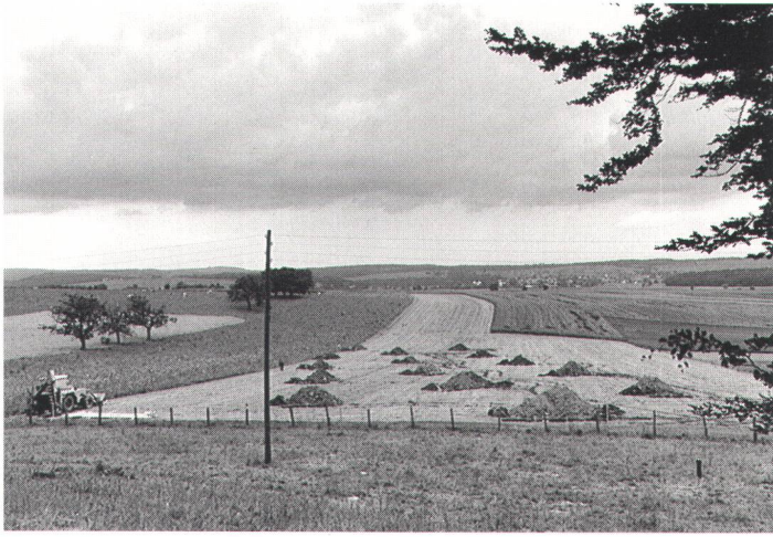
fig. 2 Disposition des sondages mécaniques systématiques dans la région du pied du Mont Terri en Ajoie. Systematische maschinelle Sondierungen am Fuss des Mont Terri in der Ajoie. Disposizione dei sondaggi meccanici sistematici nella regione ai piedi del Mont Terri, in Ajoie.