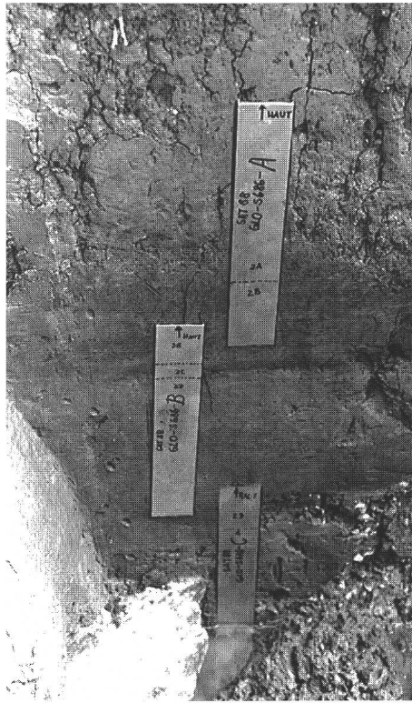
fig. 4 Prélèvements de sédiments aux fins des analyses sédimentologiques et palynologiques au moyen de boîtes en aluminium à profil en U. Sedimentprobenentnahme für sedimentologische und palynologische Untersuchungen. Prelevamento di sedimenti per analisi sedimentologica e palinologica.

Entre Porrentruy et Delémont, de 1986 à 1990, environ 1400 sondages ont été creusés au long des 15,6 km du tracé à ciel ouvert de la N16 10 . L'ensemble des travaux a fait l'objet de rapports annuels où sont rassemblées les données acquises 11 . Il n'est pas lieu ici d'entrer dans le détail des résultats, d'autant plus qu'aucune approche synthétique n'a encore été entreprise. De plus, selon l'optique dans laquelle on se place, à savoir soit une archéologie « traditionnelle » (sondages dans le seul but de trouver des gisements), soit l'expérience telle qu'elle a été tentée dans le Jura, les résultats positifs ne se calculent absolument pas de la même manière. Dans le premier cas, entre Porrentruy et Delémont, les sondages ont abouti ou conduiront à la fouille de plus de 15 sites de types divers et d'époques très variées, dont plusieurs ont déjà fait l'objet de monographies ou d'articles préliminaires 12 . En