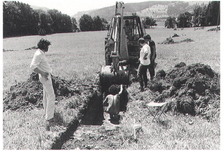
fig. 3 Observation du travail de la pelle mécanique et des sédiments dégagés au cours du creusement d'un sondage. Beobachtung der Sedimente während der Sondierung. Osservazione durante lo scavo di un sondaggio.

Ainsi dans chaque cas on se trouvait devant le besoin de confirmer ou d'infirmer la présence d'un site par un sondage dans le terrain. Sur un autre plan, de longues portions du tracé de la N16 paraissaient vides alors que le relief semblait favorable à des activités humaines. Dans ces cas là aussi, seuls des sondages au sol pouvaient apporter des réponses définitives.