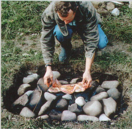
Abb. 3 Der Hasenbraten wird auf die heissen Steine gelegt. On dépose le lapin sur les pierres brûlantes. L'arrosto di lepore viene posto sulle pietre incandescenti.

Um Erfahrungen über den Verwendungszweck von Hitzesteinen und Werkgruben zu sammeln, führten wir folgenden Versuch durch: In einer frisch ausgehobenen Grube wurde ein Feuer entfacht, auf welches man nach eineinhalb Stunden gewaschene Steine von 10-30 cm Durchmesser warf. Nach etwa zwei Stunden rückten wir die heissen Gerölle mit einem Holzstück eng zusammen und legten einen geschlachteten Hasen darauf (Abb. 3). Während etwas mehr als einer Stunde wurde dieser nun ab und zu gewendet, bis er gar gebraten war. Er blieb dabei vollständig frei von Asche oder sonstiger Verschmutzung. Die auf der Grubensohle liegende Glut verlängerte die Hitzespeicherung der Steine noch über mehrere Stunden. Nach dem Abkühlen untersuchten wir die Hitzesteine: An allen 35 zeigten sich Brandrötungen; 20 waren zerplatzt oder wiesen Risse auf. Die Grubenwände waren vom Feuer gerötet oder geschwärzt. Die Grubensohle zeigte nur zu zwei Dritteln Verfärbungen infolge der Hitze. Unsere Experimentiergrube präsentierte sich nach dem Brand sehr ähnlich wie die oben beschriebene mittelbronzezeitliche Werkgrube.