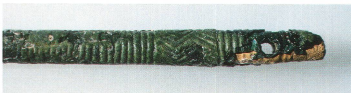
Abb. 8 Mittelbronzezeitliche Gewandnadel. ø ca. 4,5 mm. Épingle vestimentaire du Bronze moyen. Spillone della media età del Bronzo.