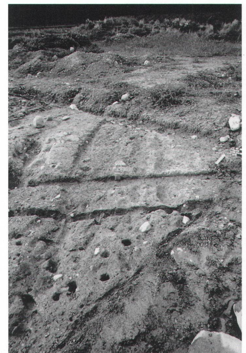
Abb. 2 Mögliche mittelbronzezeitliche Wagenspuren. Zwei moderne Schnitte verlaufen quer dazu. Foto KA ZG, P. Moser.

Sentiero della media età del Bronzo costruito reimpiegando pietre da combustione.