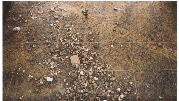
Abb. 1 Mittelbronzezeitlicher Weg aus sekundär verwendeten Hitzesteinen und Keramikscherben.

Eindeutige Hinweise für die primäre Verwendung der heissen Steine fehlen uns vorderhand noch. Immerhin fand sich eine eckige mittelbronzezeitliche Grube von etwa 2 x 1 m Seitenlänge mit geröteten Wänden. Einige der zahlreich auf der Grubensohle liegenden Hitzesteinfragmente liessen sich wieder zu ihrer ursprünglichen Grösse von ca. 20 cm Durchmesser zu-