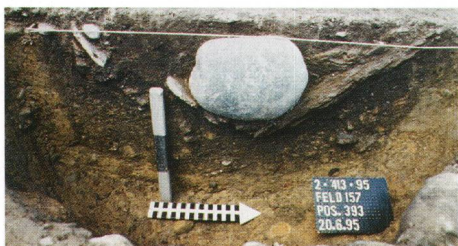
Abb. 7 Mittelbronzezeitliche Grube mit Keramikscherben und einem Ambossstein. Fosse du Bronze moyen avec tessons de céramique et une pierre servant d'enclume. Fossa della media età del Bronzo con frammenti ceramici e pietra con funzione di incudine.

Organisches Material wie Knochen, Horn oder pflanzliche Reste konnte sich in der Regel im sauerstoffreichen Boden nicht erhalten. Letztere überdauerten die Zeit nur in verkohltem Zustand. Petra Zibulski vom Botanischen Institut der Universität Basel kommt aufgrund der bisher rund 550 Liter geschlammten mittelbronzezeitlichen Erdmaterials auf folgende, vorläufige Resultate: Die Funddichte des archäobotanischen Materials ist, ausser in zwei Gruben, generell sehr tief. Unter den Funden ist Drusch von verschiedenen Weizenarten dominant: Emmer, Dinkel und Einkorn, wobei