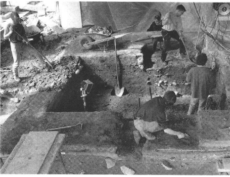
Ausgrabung im alten Schulhaus von Messen. Foto KA SO.

Unter dem schon seit langem bekannten Gutshof römischer Zeit müssen sich Reste eines früheren Hofes befinden, der von keltischen Helvetiern bewohnt war. Das älteste Stück, ein Fragment eines Armreifs aus dunkelblauem Glas, datiert in die Zeit um 200/150 v. Chr. Andere Fundstücke belegen, dass der Platz durchgehend bewohnt war, mindestens bis in die hohe Kaiserzeit um 250/300 n. Chr.; das entspricht rund 450 Jahren oder 15 Generationen. Mit Ausnahme von Beispielen aus der Region Genf, ist die Villa rustica von Messen der bisher erste römische Gutshof in der Schweiz, der unmittelbar auf ein keltisches Gehöft folgte. Wenn es uns gelingt, auch die Lücke zu schliessen zwischen dem römischen Gutshof und den frühmittelalterlichen Gräbern des 7. Jahrhunderts in der Kirche, so wäre Messen der älteste durchgehend bewohnte Ort des Kantons!