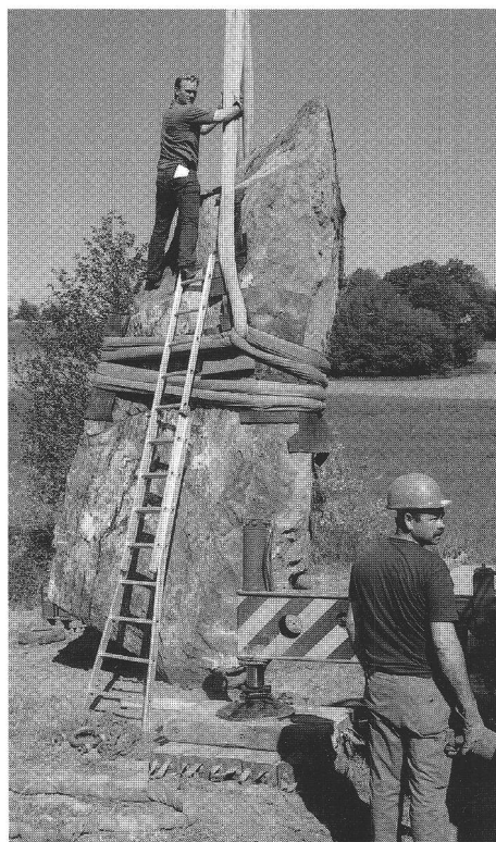
Déplacement et remise en place du menhir.