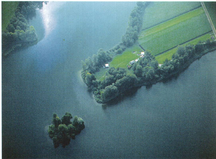
Abb. 1 Luftbild Nussbaumer See mit Halbinsel Horn. Vu aérienne du lac de Nussbaumen avec la presqu'île de Horn. Fotografia aerea del lago di Nussbaum e della penisola Horn.

Die im späten 9. Jahrhundert v. Chr. errichtete Siedlung Uerschhausen-Horn liegt auf einer Halbinsel am Nussbaumer See (Abb. 1). Sie wurde erstmals 1970 1 untersucht und von 1985 bis 1990 von der Kantonsarchäologie Thurgau grossflächlich ausgegraben 2 .