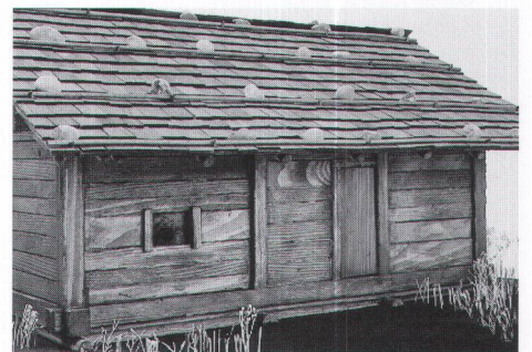
Abb. 3 Blockbau- (oben) und Bohlenständerbaummodell (unten). Rekonstruktion H. Gollnisch, Ausführung Architekturbüro Gnädinger St.Gallen, Fotos AATG, D. Steiner. Schéma de construction d'une maison en rondins (en haut) et en planches (en bas). Costruzione a tronchi (in alto) e ad assi infisse (in basso).

nur schätzen oder anhand völkerkundlicher Vergleiche erahnen. Am ehesten darf man mit Kleinfamilien rechnen, also mit max. fünf, in den (selteneren) grösseren Häusern vielleicht auch mit bis zu sieben oder acht Personen. Waren die Kinder erwachsen, bezogen sie vermutlich ihr eigenes Haus; Umbauten bzw. Hauserweiterungen sind in Uerschhausen nur selten nachgewiesen. Insgesamt ergibt sich für die Siedlung eine Einwohnerzahl von mind. 300, mehr als dreimal soviel wie das heutige Dorf Uerschhausen (Abb. 6).