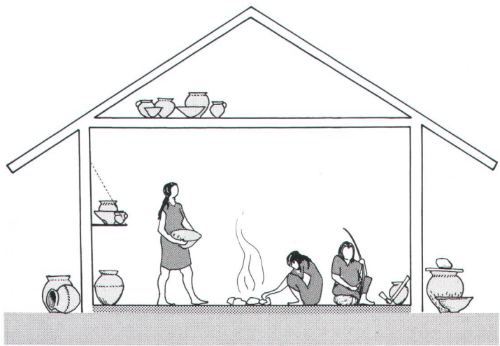
Abb. 4 Schematische Darstellung des Hausinneren mit Feuerstelle. Rekonstruktion H. Gollnisch, Zeichnung AATG, D. Steiner. Schéma de l'intérieur d'une maison. Rappresentazione schematica dell'interno di una casa con focolare.