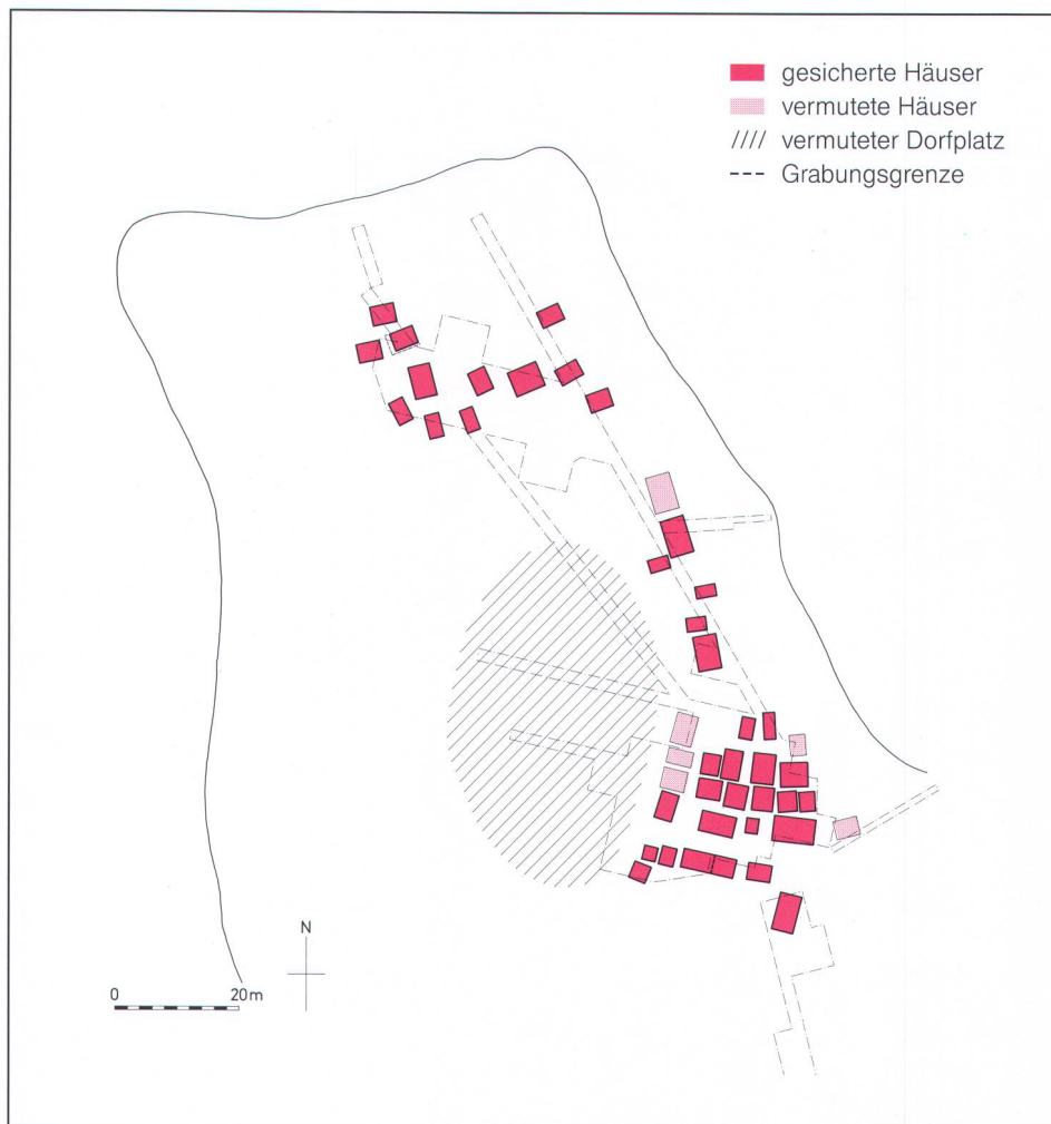
Abb. 2 Siedlungsplan Uerschhausen-Horn. Umzeichnung AATG, M. Lier/M. Schnyder. Plan du site d'Uerschhausen-Horn. Pianta dell'abitato di Uerschhausen-Horn.