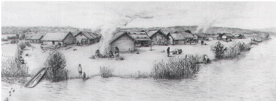
Abb. 6 Leben im Dorf Uerschhausen (Ansicht von Osten). Rekonstruktion H. Gollnisch, Zeichnung und Foto AATG, D. Steiner. Scène de la vie quotidienne à Uerschhausen (vue de l'est). Scena di vita nel villaggio di Uerschhausen (veduta da est).