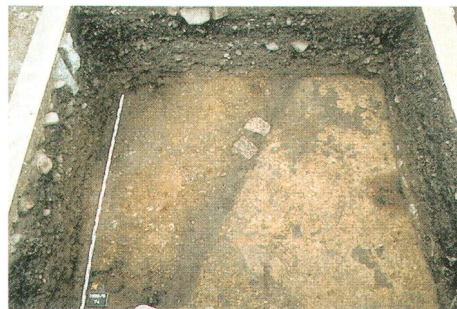
Abb. 3 Blick auf die Überreste eines römischen Fachwerkbaus. Rechts ein Fussboden aus gestampftem Lehm im Inneren des römischen Hauses, links der Kieskoffer der römischen Strasse. Im Gräbchen in der Bildmitte lagerte ursprünglich der hölzerne Schwellbalken der Fachwerkwand.

Zu »terracotta« gebrannte Lehmbröckchen mit Abdrücken der Konstruktionshölzer und der Rutengeflechte der Fachwerkwände bezeugen, dass zwei (der insgesamt fünf) Bauphasen durch grossflächige Brandkatastrophen zerstört worden sind. Bei der Auswertung der über 90 römischen Münzen wird sich zeigen, ob eine dieser Brandkatastrophen allenfalls mit den vom römischen Geschichtsschreiber Tacitus beschriebenen Brandschatzungen durch marodierende römische Truppen im Jahre 69 n. Chr. in Verbindung gebracht werden kann. Dem nach dem Tod von Kaiser Nero (69 n. Chr.) ausgebrochenen und von Kaiser Vespasian beendeten Bürgerkrieg fiel - laut Tacitus - auch der vicus von Aquae Helveticae (Baden AG) zum Opfer. Siedlungsspuren aus dem 2. und 3. Jh. n. Chr. fehlen im Hof des Antikenmuseums fast vollständig; der im Vorfeld des mit einem Graben geschützten Refugiums (Fluchtburg) auf dem Münsterhügel liegende Teil des vicus wurde offenbar in spät-römischer Zeit vollständig zerstört und ausplanirt.