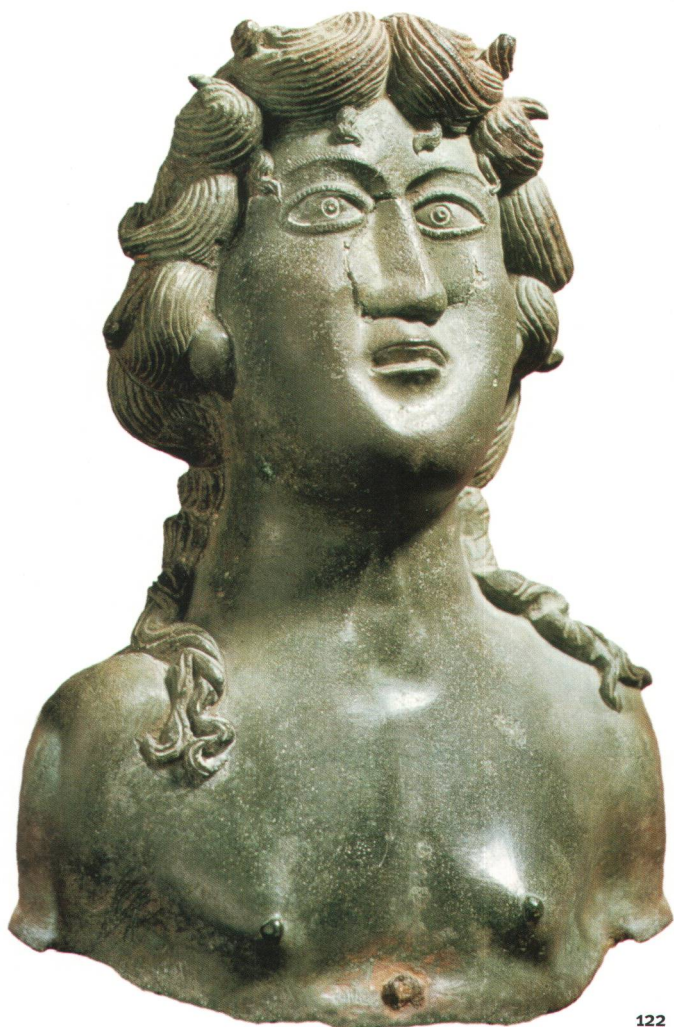
Fig. 122 Bronzebüste einer vielleicht lokalen keltischen weiblichen Gottheit. H. 21 cm.

Busto femminile di bronzo, forse una divinità celtica locale. A. 21 cm