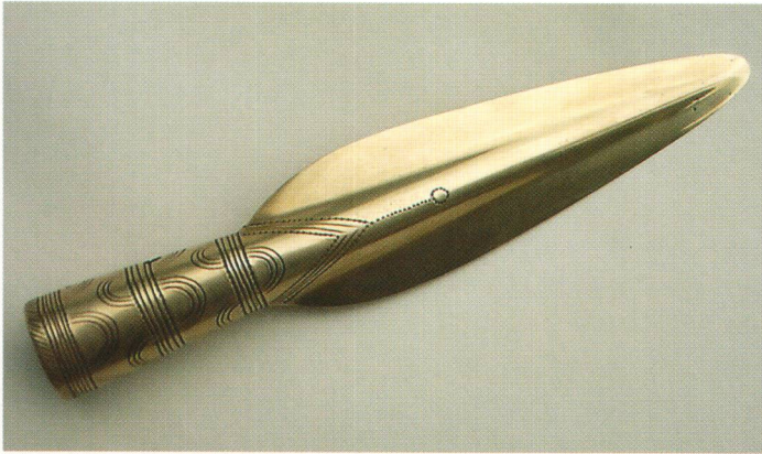
Abb. 6 Fertig bearbeitete Lanzen Spitze. Die Schneiden wurden überhämmer, die ganze Spitze überschleift und zise- liert.

len konnten) praktisch blank aus der Form! Natürlich ist das auch für die Weiterbearbeitung von Vorteil.