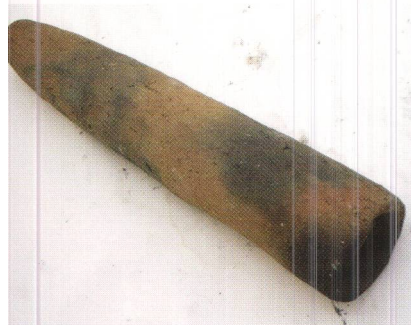
Abb. 5 Nach dem Guss aufgebrochene Form. Sichtbar ist die Schwarzfärbung des Tones im Innern der Form, die Kontaktstellen mit dem heissen Metall sind weisslich verfärbt. Die gegossene Spitze ist beinahe oxidfrei, nur der Mittelbereich, der beim Öffnen der Form noch heiss war, ist etwas angelaufen.