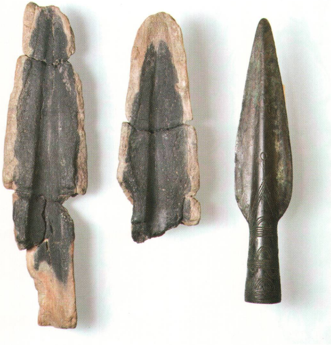
Abb. 1 Eine fast vollständig erhaltene Tongussform und eine fertig bearbeitete Lanzenspitze aus der Siedlung Zug-Sumpf.

Aus der spätbronzezeitlichen Siedlung Zug-Sumpf sind eine Reihe von tönernen Gussformfragmenten erhalten, die zur Herstellung von Lanzenspitzen dienten. Sie wurden im Innern von Haus 4 (Grabungskampagne 1952-54) gefunden und