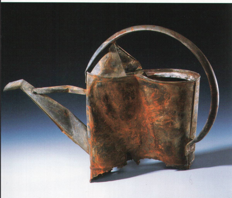
Fig. 2 Vases à libation percés et statuette de haut personnage (prêtre?). Terre cuite, fin 20 e -début 21 e siècle.

Gelochte Trankopfergefäße und Statuette einer hochgestellten Persönlichkeit (Priester?). Gebrannter Ton. Ende 20. – Anfang 21. Jahrhundert.