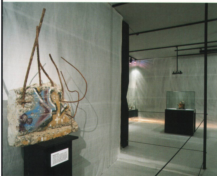
Fig. 1 Vue de l'exposition Futur antérieur . A gauche, fragment de fresque sur béton, témoignage de la maîtrise artistique du 21 e siècle.

Que restera-t-il de nous dans 2000 ans? Que comprendront d'éventuels archéologues futurs de notre mode de vie? Nombreux sont les visiteurs de sites ou de musées archéologiques qui posent ces questions. Au Musée romain de Lausanne-