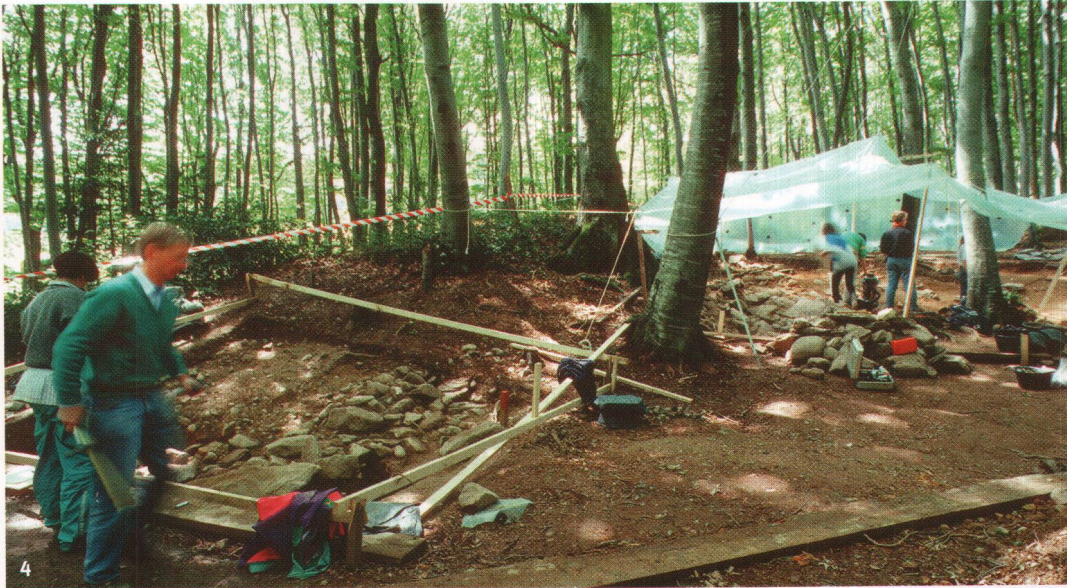
Fig. 4 Fouille-école sur le site de Vernéaz-La Redoute des Bourguignons (Vaumarcus, NE).

de l'A5. Sur le plateau de Bevaix, notamment, la plupart des étudiants concernés ont pu être directement intégrés comme stagiaires dans les équipes de fouilles professionnelles. La diminution progressive de ces travaux de terrain de grande ampleur n'a pas pour autant signifié la fin des possibilités, pour les non-initiés, de «faire de l'archéologie». En 2000-2001, les fouilles cantonales ont ainsi réservé, dans leur programmation, un volet didactique qui a permis d'accueillir les représentants des dernières promotions académiques.