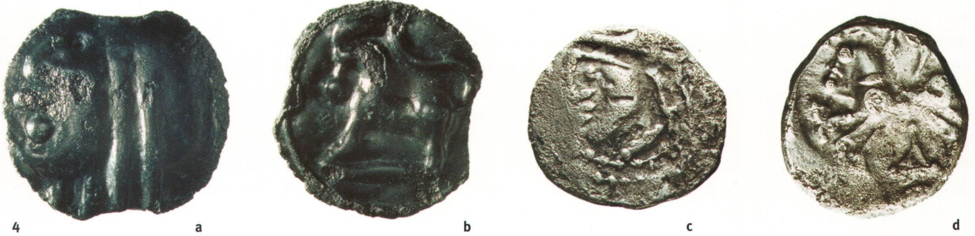
Abb. 4 Baar ZG/Kappel a.A. ZH. Keltische Münzen. a und b: Potinmünze, Sequaner, sog. Typ «à la grosse tête»; Vorderseite: menschlicher Kopf nach links schauend; Rückseite: Tier nach links (Stier, Hirsch, Steinbock?); ca. 1,7 cm Durchmesser. c und d: Kaletedou-Quinar; Vorderseite: menschlicher Kopf nach links schauend; Rückseite: Pferd und Umschrift [KAA]-Δ-Y (aufgelöst und ergänzt: KAAETEAOY); ca. 1,3 cm Durchmesser.