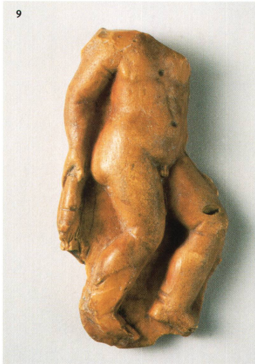
Abb. 9 Birmensdorf ZH. Applique aus Bernstein mit einer Darstellung des Amors.

Reuss, die sicher die Hauptverbindung mit dem Legionslager und dem vicus Vindonissa (Windisch AG) bildete. So erstaunt nicht, dass im Reusstal zahlreiche und bedeutende Siedlungen liegen, wie etwa die grossen Anlagen von Obfelden-Lunnern ZH oder Unterlunkhofen AG. Die spätrömi-