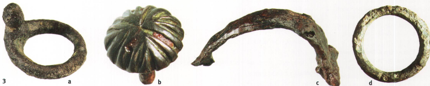
Abb. 3 Baar ZG/Kappel a.A. ZH. Keltischer Gürtelhaken und Zierknopf (a und b); römische Fibel aus Eisen (c); Ringlein aus Bronze unbestimmter Zeitstellung (d).

Nebst den 35 kaiserzeitlichen Münzen (34 aus dem Depot, 1 aus der Umgebung) fanden sich auch keltische und republikanische Münzen (Abb. 2 und 4). Die beiden keltischen Geldstücke stammen aus dem östlichen Mittelgallien, d.h. aus dem Gebiet des heutigen Ostfrankreich oder der Nordwestschweiz. Die Typen, ein Sequaner Potin des Typs «grosse