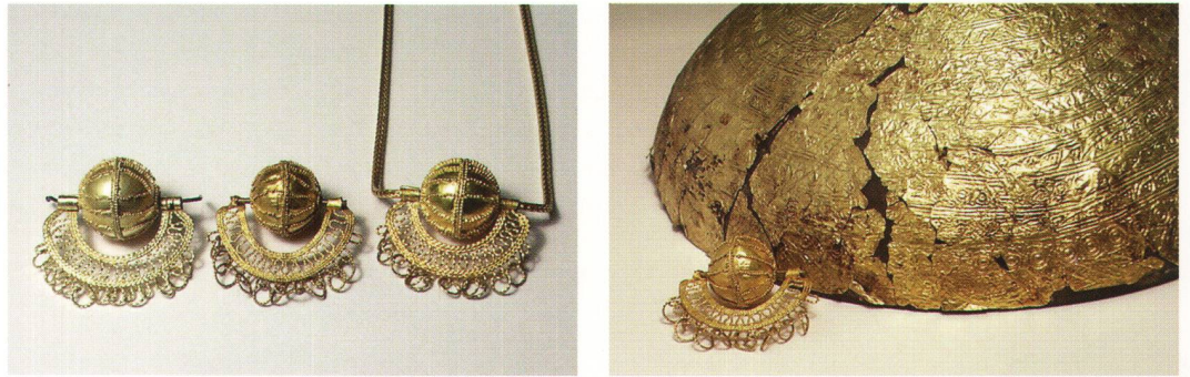
Abb. 5 Zwei gleich alte Goldgegenstände aus der gleichen Legierung. Das Goldgehänge zeigt gleichmässige Feingoldfarbe, die Blechschale hellgelbe und feingoldfarbene Partien, durchsetzt von braunen Oxidflecken.

Qualität der Arbeit aus heutiger Sicht dadurch vermindert wird! Ebenso wird dadurch gezeigt, dass nicht allein aus dem Umstand, dass bei einer Granulationsarbeit die Kugelzwischenräume mit Lot ausgefüllt sind, auf die Verwendung von metallischem Streulot geschlossen werden kann.